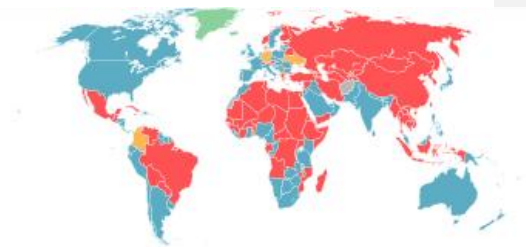
Mapa1.situação da conscrição no mundo 5

Devido à falta de elementos, quer dados, quer referências de pesquisa relativos ao recrutamento, a investigação será orientada para a modalidade de recrutamento normal e irá centrar-se no SN. Em segundo lugar, mostrar-se-á o modelo argelino “As escolas dos cadetes da nação” como uma medida estratégica para fazer face a qualquer interrupção na taxa de recrutas e apoiar o processo de modernização.