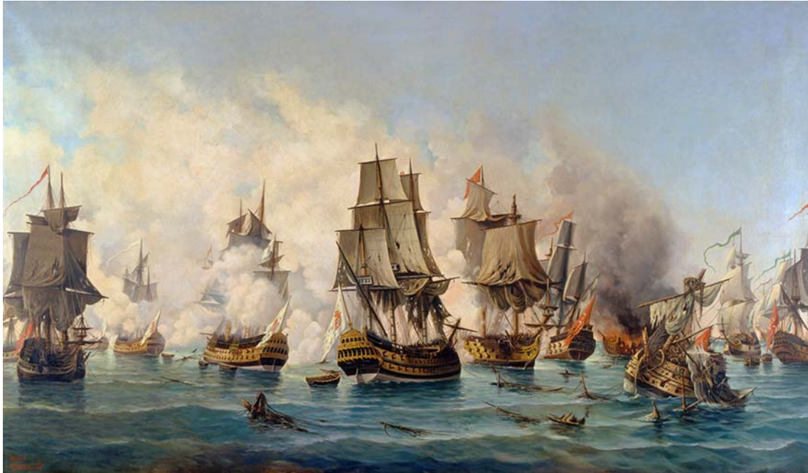
Figura 3 – Pintura da Batalha Naval do Cabo de Matapão

derrotadas, em grande parte devido à ação da esquadra portuguesa (Monteiro, 1996, pp. 97-109).