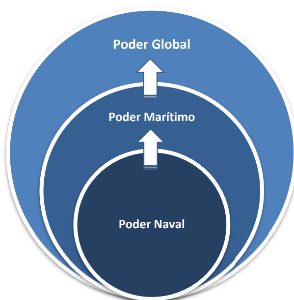
Figura 1 – Do Poder Naval ao Poder Global – modelo “clássico”

Uma vez consumado o poder naval, através da superioridade militar no mar obter-se-ia o Poder Marítimo, que consiste no controlo do comércio marítimo à escala global. Deste modo, e segundo a generalidade dos autores, todos os poderes globais hegemónicos dos últimos cinco séculos foram simultaneamente os maiores poderes navais do seu tempo (Modelska & Thompson, 1988).