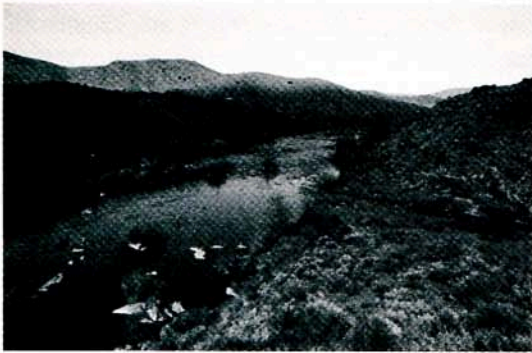
Rio Côa, próximo do sítio da Penascosa (Castelo Melhor)

Sendo assim, devemos começar por lembrar que a maior parte das freguesias pertenceram outrora ao concelho de Freixo de