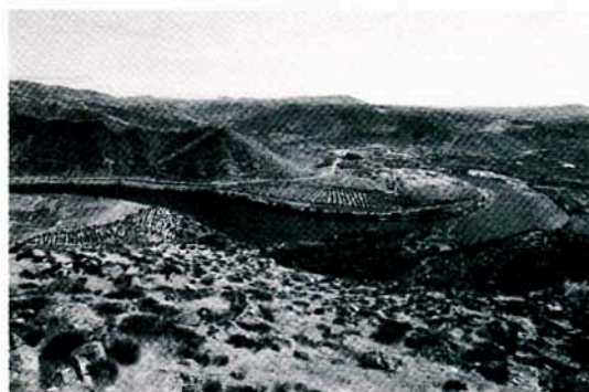
Rio Douro, próximo do Pocinho

E antes? Quando Portugal se afirma como reino independente, o Entre-Águeda-e-Côa era uma zona desolada, a bem dizer deserta. É claro que há peças essenciais do 'puzzle' que nos faltam. O que se passou após o fim do domínio romano? Houve ou não presença sueva por aqui? Sobretudo, o que levou os Visigodos a fundar o intrigante bispado de Calabria , com sede numa povoação provavelmente pré-romana, " supra Dorium fluvium in vertice montis excelsi sita " (e cuja exploração arqueológica, que está a ser estudada, poderá trazer res-