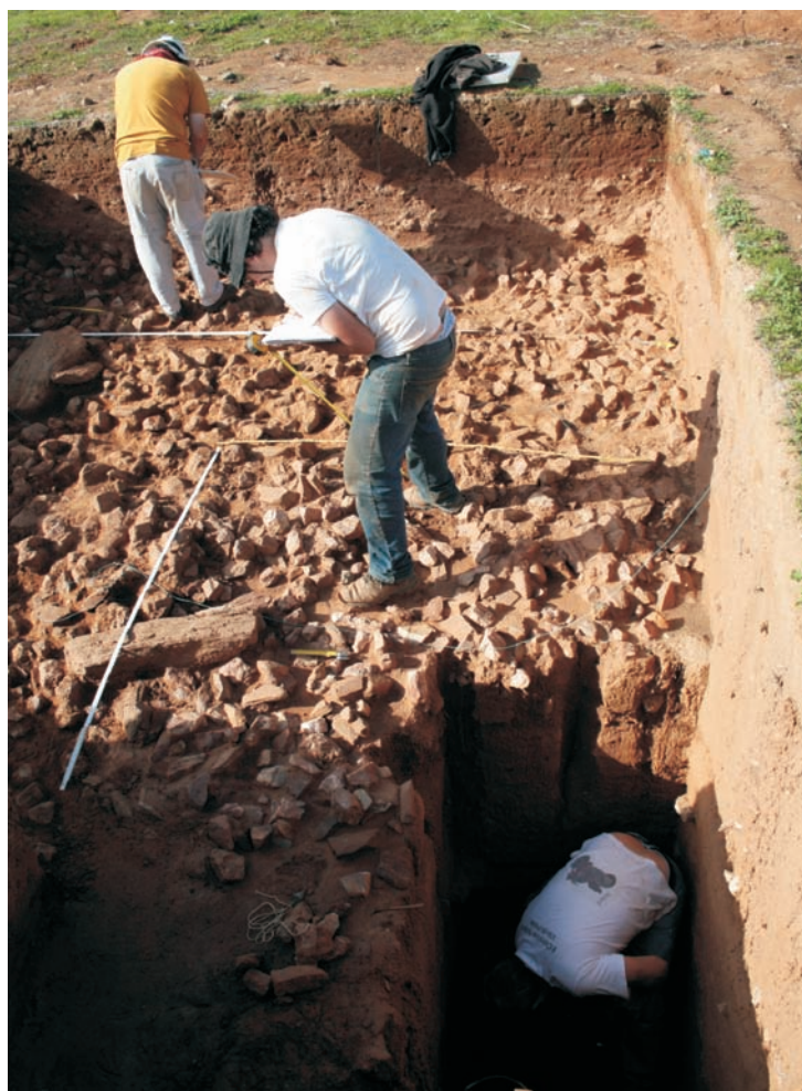
Fig. 7: Estrutura pétrea gravettense e sondagem nas camadas mais antigas, atribuídas ao Paleolítico médio.

Independentemente disso, a existência deste tipo de estruturas implica um modo de ocupação do sítio que contrasta com a ocupação magdalenense. A construção e utilização de estruturas desta dimensão denunciam um