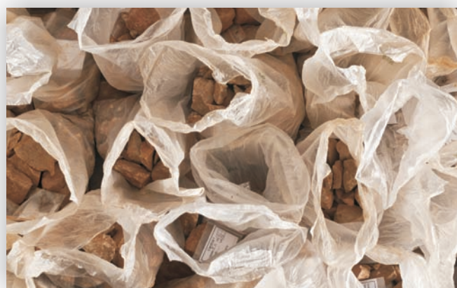
Fig. 5: Materiais recolhidos em escavação antes do seu tratamento e estudo para integração no espólio do Museu do Côa.