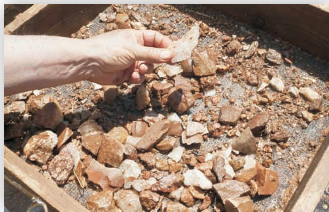
Fig. 4: Crivagem a água de uma unidade arqueológica, evidenciando a abundância de material arqueológico.

2 Estes trabalhos foram realizados por técnicos da Fundação Côa Parque, com a colaboração de investigadores da DGPC, UNIARQ (Universidade de Lisboa) e Universidade de Barcelona, e contaram com o apoio logístico da Junta de Freguesia de Santa Comba e da Câmara Municipal de Vila Nova de Foz Côa.