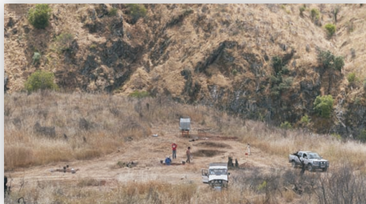
Fig. 3: Aspeto geral da 1ª campanha de escavação da Cardina em 2014.

Nos níveis magdalenenses observou-se uma forte densidade de pequenas fogueiras, constituídas por blocos ou seixos de riólito, quartzo, quartzito, xisto e granito, que se dispersam por toda a área escavada. Esta distribuição poderá ser interpretada como resultando de uma única ocupação por um grande grupo humano, ou como uma sucessão de reutilizações de espaços adjacentes por um pequeno número de pessoas, ao longo da plataforma. Qualquer que seja a interpretação, a dispersão de pequenas estruturas de tipologia semelhante parece apontar para uma sociedade atomizada, baseada em pequenas unidades de tipo familiar. A interpretação