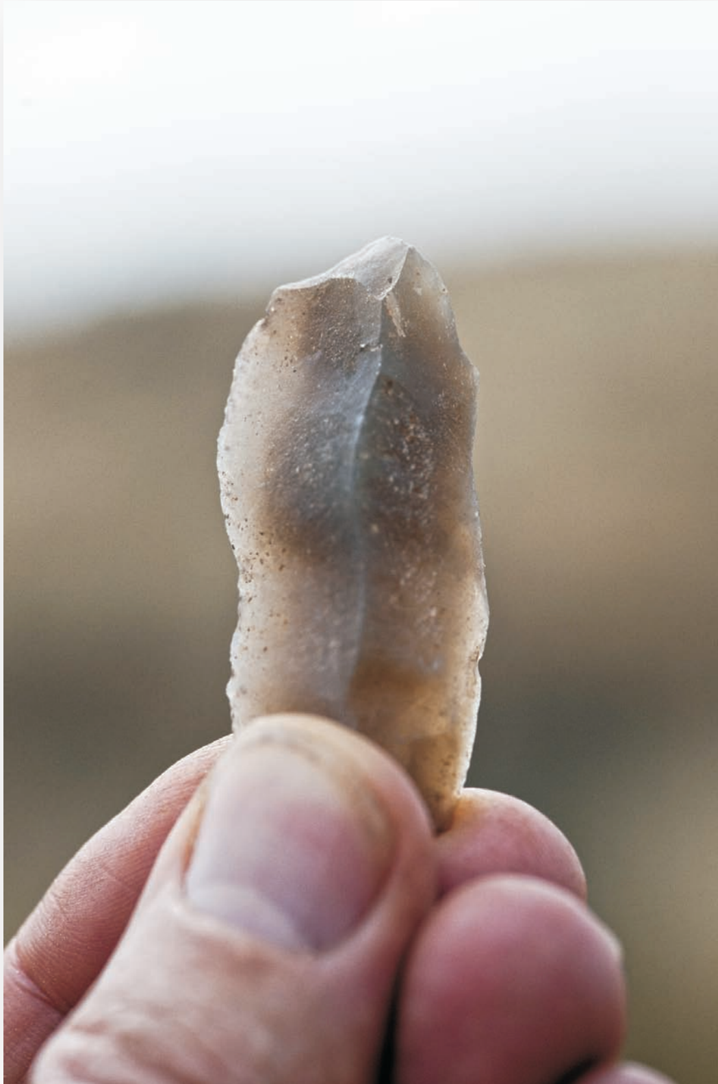
Fig. 6: Utensílio sobre lâmina em sílex no momento da sua descoberta.