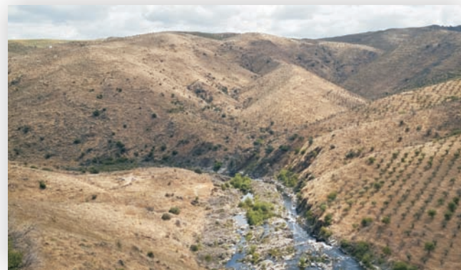
Fig. 1: Vista geral do sítio da Cardina (Santa Comba)

Por comodidade, utilizamos o termo “arte” para designar as manifestações gráficas das sociedades de caçadores-recolectores do passado, embora tenhamos consciência de que para elas isso teria um sentido distinto do que a arte tem para a nossa sociedade.