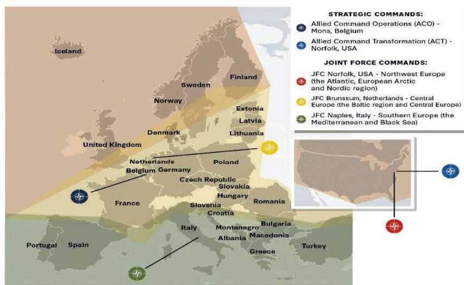
Figura 2 – Áreas dos planos de defesa regionais e respetivos comandos de forças da OTAN