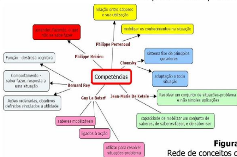
Figura 1 Rede de conceitos de competências

Considera-se competência profissional a combinação de conhecimentos, de saber-fazer, experiências e comportamentos, exercidos num contexto preciso. São aptidões e características