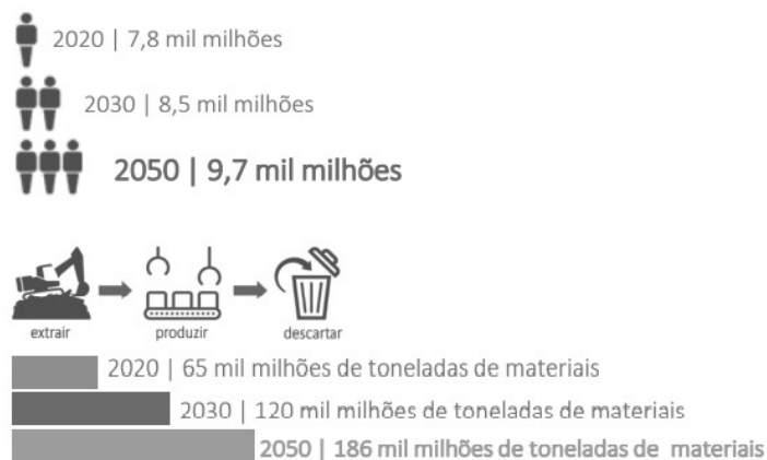
Figura 4. A importância da Economia Circular (evolução de recursos e resíduos)