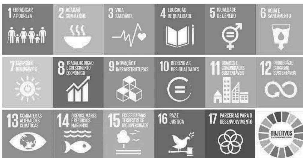
Figura 2. Objetivos de Desenvolvimento Sustentável (ODS)