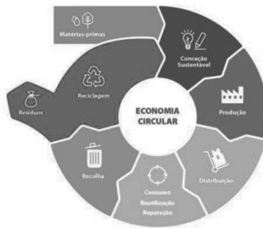
Figura 5. O modelo de Economia Circular