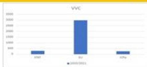
Gráfico 1: Ativações da VVC