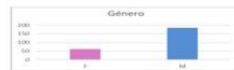
Gráfico 4: Género predominante na VVC