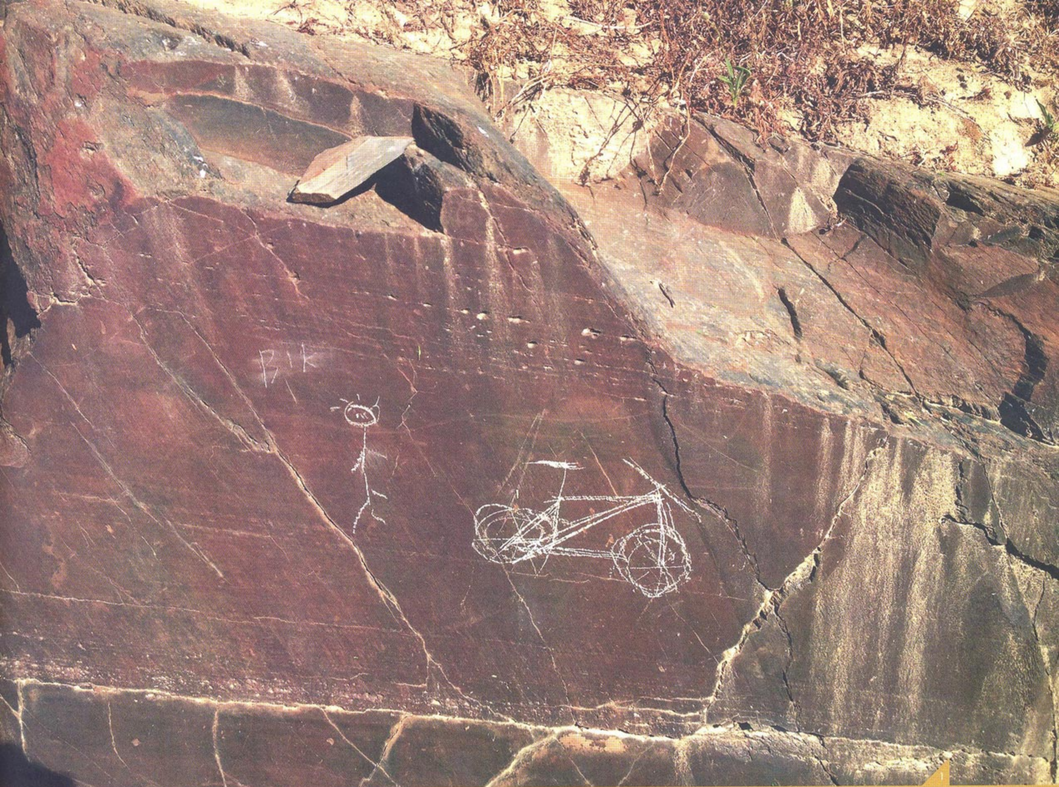
1. Imagem do acto de vandalismo realizado na rocha 2 da Ribeira de Piscos no dia 25 de Abril de 2017. Os novos motivos sobrepõem-se a figuras paleolíticas, incluindo a figura humana conhecida como "Homem de Piscos".

turística (com claro destaque para a própria Arte do Côa e o turismo fluvial/vínico no Douro) e um crescente aproveitamento do seu potencial agrícola, com a instalação de numerosas explorações modernizadas, carece claramente de uma gestão e ordenamento capazes de dar resposta aos novos desafios e perigos implícitos nesta transformação da paisagem que está em curso.