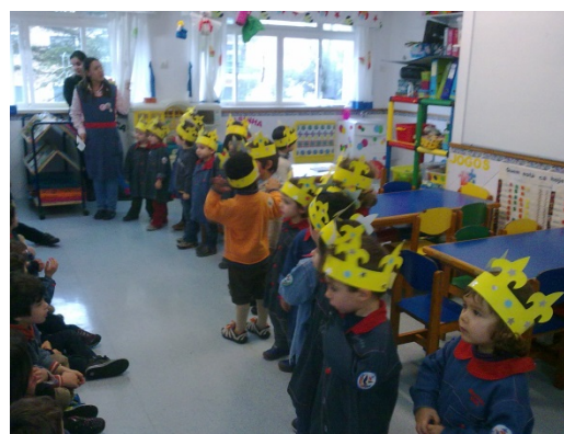
Figura 15 – Partilha com a sala dos cinco anos