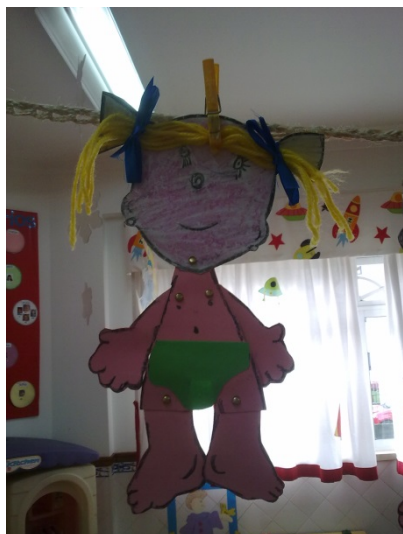
Figura 1 – Boneca articulada

atividade só foi possível de concretizar depois de as crianças já terem adquirido os conhecimentos pretendidos relativamente ao tema.