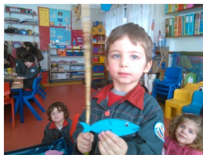
Figura 4 – “Jogo da Pesca”

Para além das atividades apresentadas muitas outras foram realizadas. Para a planificação destas atividades tivemos sempre em linha de conta as orientações da Educadora cooperante relativamente às estratégias a utilizar, às competências que as crianças deviam desenvolver e aos conceitos a abordar.