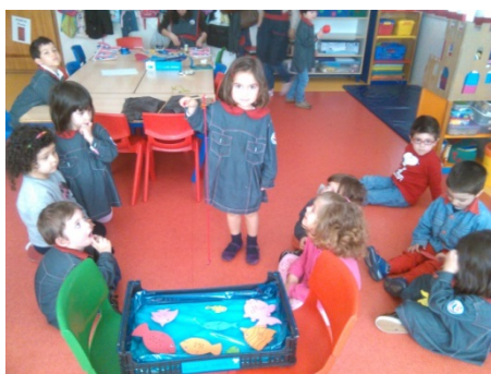
Figura 3 – “Jogo da Pesca”

Depois de realizada a atividade o material foi deixado na sala para que a Educadora pudesse utiliza-lo nas suas atividades e também para as crianças o explorarem com a autorização da Educadora.