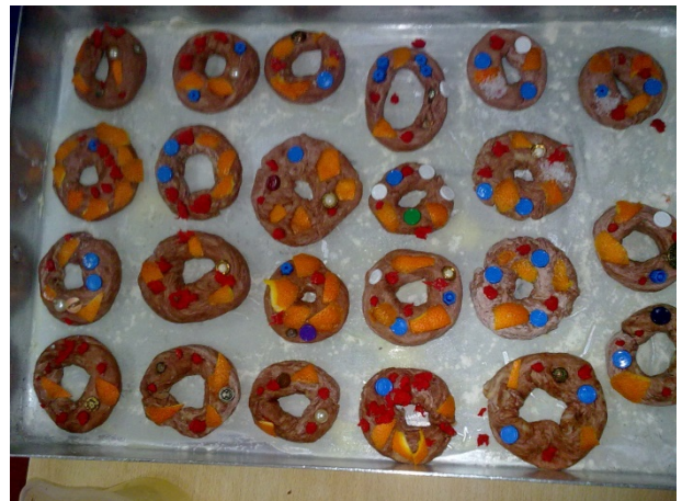
Figura 7 – Bolos-rei

Por fim, é na área da Formação Pessoal e Social que nos deparamos com o maior número de atividades realizadas durante a nossa prática pedagógica. Assim as nossas planificações visaram sempre o desenvolvimento de competências básicas de socialização e a aquisição e apreensão de valores.