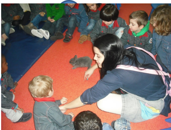
Figura 6 – Animais mamíferos – “Coelho”

Quanto à área do Conhecimento do Mundo esta foi trabalhada em cerca de 20 atividades, sendo que se destacam como atividades principais, as atividades em que abordamos as classes dos animais, mais especificamente os animais de estimação; a semana dos Reis em que preparámos bolos-rei, entre outras.