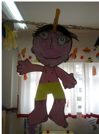
Figura 2 – Boneco articulado

Consideramos que esta atividade foi bem sucedida, visto que o tema do corpo humano nesta faixa etária não é de fácil abordagem, e através da Expressão Plástica, as crianças concretizaram as suas aprendizagens. Katz (1999) refere que as expressões são uma das formas de linguagem mais utilizadas pelas crianças em idade pré-escolar, sendo que ainda não possuem competências ao nível da leitura e da escrita. Assim, através das expressões (pintura, escultura, teatro, dança, música, entre outras) as crianças são capazes de “explorar e expressar entendimentos do mundo” (p.45).