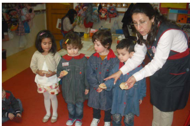
Figura 12 – Divisões do pão

algumas coisas de forma equitativa e conseguiram dividir o pão em partes iguais e partilhá-lo com os colegas. Com esta atividade trabalharam a área da Linguagem Oral e Abordagem à Escrita com a exploração da história, a área do Conhecimento do Mundo com as fases do ciclo do pão, a área da Matemática com as divisões e contagens e ainda, a área que pretendíamos que as crianças trabalhassem com maior intensidade, a Formação Pessoal e Social, com a partilha do pão.