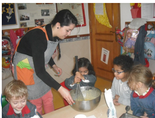
Figura 14 – Preparação do bolo

Para tornar esta atividade ainda mais significativa, no dia seguinte finalizámo-la com a preparação de um bolo. As crianças ficaram entusiasmadas porque lhes dissemos que iam partilhar aquele bolo com os meninos da sala dos cinco anos. Depois de perceberem a importância de partilharmos as nossas coisas com os outros as crianças estavam muito satisfeitas com a ação que iam praticar.