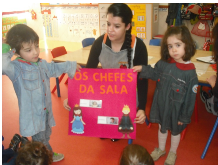
Figura 11- Seleção dos chefes

Aqui vamos apresentar a atividade que abrangeu o maior número de áreas de conteúdo. Teve a duração de três dias e surgiu no seguimento da temática do “Ciclo do Pão”. Para darmos início à atividade começámos com a leitura e exploração da história “A galinha ruiva” (Anexo 19) trabalhando o domínio da compreensão de discursos orais e interação verbal. Durante a exploração do texto abordámos conceitos relacionados com o ciclo do pão e também com a mensagem que a história transmitia, a importância da cooperação e da partilha. Utilizámos esta estratégia pois, segundo Bettelheim (1999, p.11), para que uma história possa prender a criança verdadeiramente, é importante que esta para além de a distrair e despertar a sua curiosidade, enriqueça a sua vida, estimulando a sua imaginação, e sugira soluções para os problemas através da transmissão de valores.