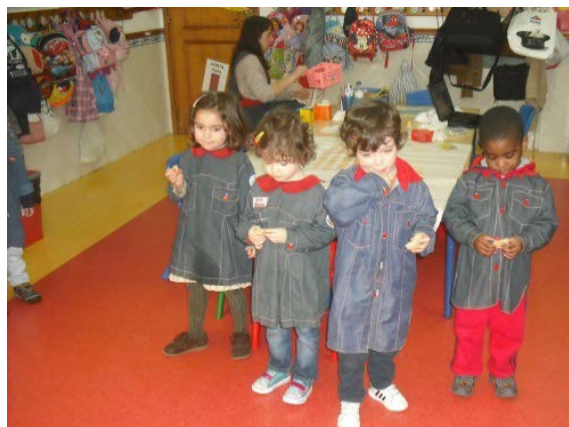
Figura 13- Partilha do pão

Para tornar esta atividade ainda mais significativa, no dia seguinte finalizámo-la com a preparação de um bolo. As crianças ficaram entusiasmadas porque lhes dissemos que iam partilhar aquele bolo com os meninos da sala dos cinco anos. Depois de perceberem a importância de partilharmos as nossas coisas com os outros as crianças estavam muito satisfeitas com a ação que iam praticar.