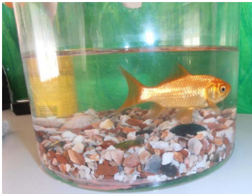
Figura 8– O “Boby Laranja”