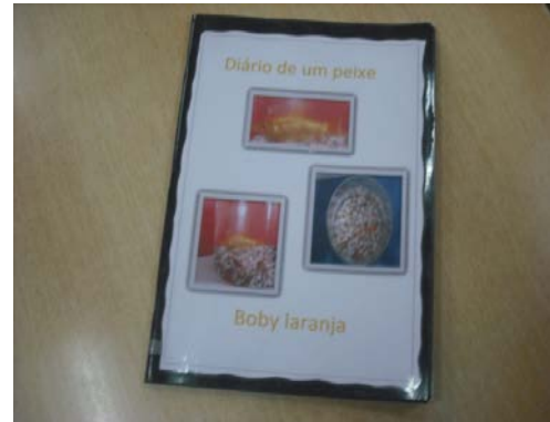
Figura 9- O diário do “Boby Laranja”

Uma outra atividade que surgiu no contexto da nossa área de intervenção, foi a introdução dos “Chefes da Sala” -Anexo 17. Este foi outro projeto suscitou-nos bastante interesse durante a nossa intervenção, quando nos deparamos com o facto de algumas crianças não interagirem no decorrer das atividades de forma significativa, ou seja, como referimos anteriormente muitas crianças tinham uma personalidade forte o que acontecia era que não se faziam notar nas atividades pelas melhores atitudes. Uma outra razão para o aparecimento deste projeto centrou-se no comportamento das crianças, isto é, durante a nossa observação e mesmo na intervenção, apercebemo-nos de que o grupo tinha algumas dificuldades em respeitar as ordens dos adultos -Anexo 18- durante as atividades, então, considerámos pertinente a existência diária de chefes da sala. Estes chefes eram selecionados diariamente após o período do tapete e mediante o seu comportamento e ficavam responsáveis por auxílio aos adultos nas tarefas do dia, apoiar a auxiliar no período anterior aos almoços, com a colocação das mesas, por repreender os colegas em momentos de conflito ou de comportamentos menos corretos com o consentimento de um adulto.