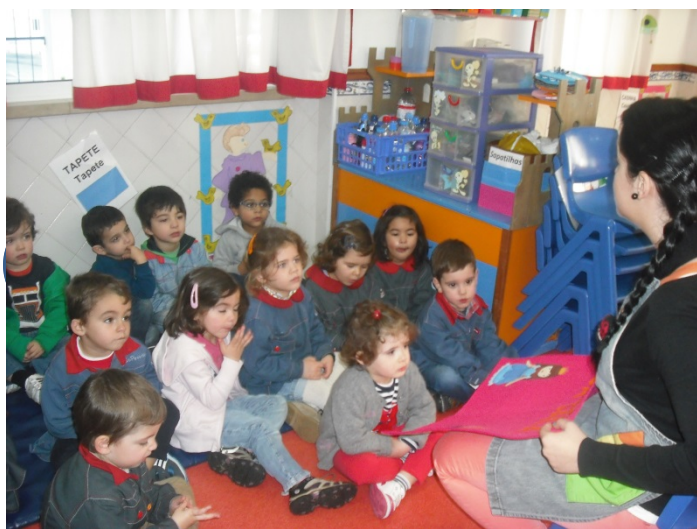
Figura 10 – Implementação do projeto

crianças preocuparem-se com o comportamento. Este projeto foi bastante importante para a nossa área de intervenção uma vez que as crianças começaram a ter mais consciência relativamente aos seus comportamentos, começaram a compreender a importância de desempenhar uma função, tendo em conta o benefício do outro e também porque as crianças aprenderam conceitos como a responsabilidade.