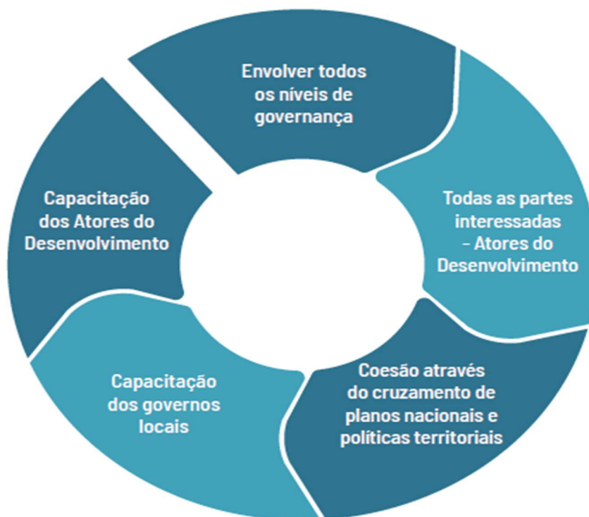
Figura 5 - Localização