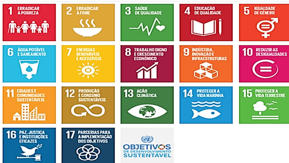
Figura 3 - Agenda 2030: Objetivos para o Desenvolvimento Sustentável

Na figura (3) são conhecidos os 17 ODS ao pormenor: