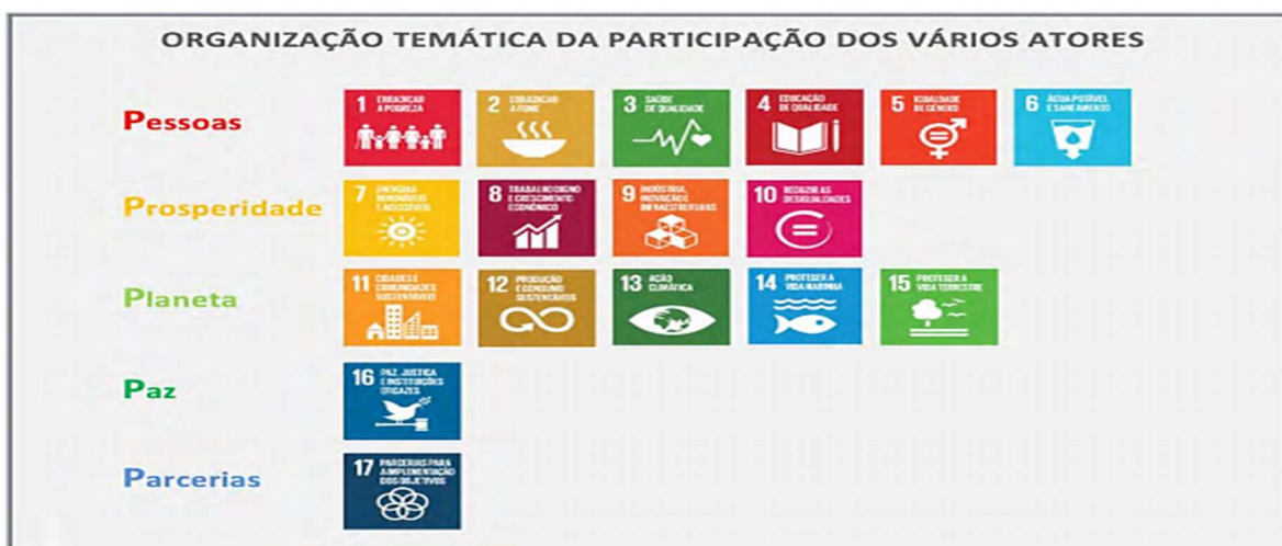
Figura 2 – Organização Temática de acordo com o Relatório Voluntário de Portugal

Na figura (2) temos a perceção dos ODS divididos entre os cinco pilares: