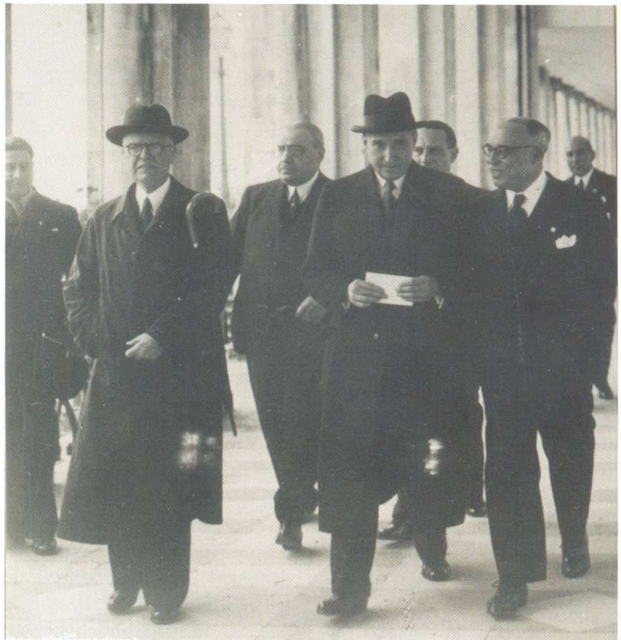
NA ESTAÇÃO do Rossio aguarda-se a chegada do marechal Carmona da sua viagem ao Porto (12-2-1949).

Um a um, os oradores de todos os quadrantes enfatizam a sua admiração, o seu apreço, a sua inultrapassável lealdade àquele que, ausente, se revelará, no entanto, omnipresente num hemiciclo em que uns tentavam agarrar o tempo que anunciava a mudança e parecia fugir-lhes por entre os dedos e outros tentavam empurrá-lo para a frente como se estivessem diante de um peso morto. /A.A.C.