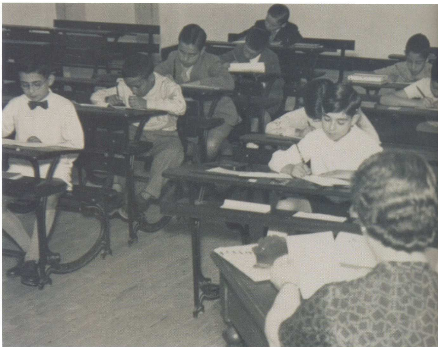
ALUNOS concentrados nos exames da instrução primária no distrito escolar de Lisboa, em 1941.