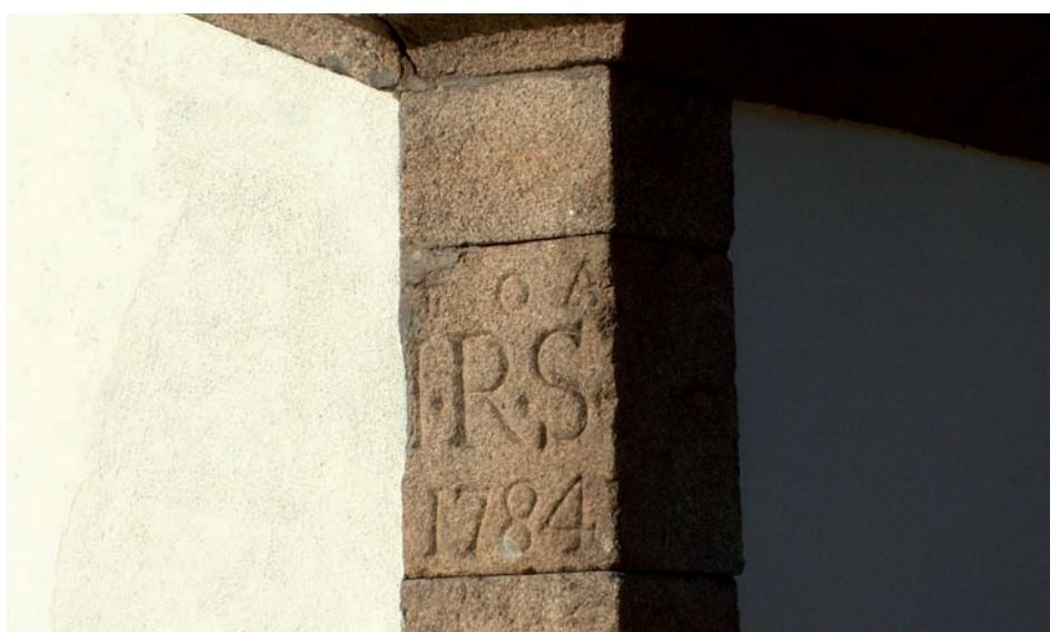
fig. 2 Cunhal da Capela de S. Marcos.