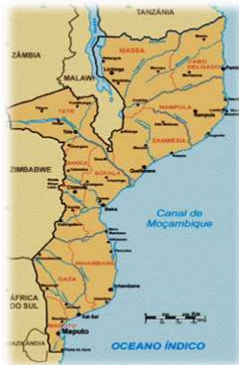
Figura 1: Mapa de Moçambique