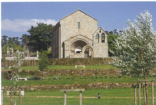
Mosteiro de São Pedro de Ferreira | Paços de Ferreira

A Igreja do Mosteiro de São Pedro de Ferreira é um dos mais expressivos monumentos do românico português.