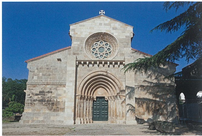
Mosteiro do Salvador de Paço de Sousa | Penafiel

Em 1928, o Mosteiro de Ferreira foi classificado como Monumento Nacional. Em 2004-2005, foi alvo de obras de conservação geral, no âmbito da “Rota do Românico do Vale do Sousa”, que abrangem as coberturas, paredes, vãos exteriores e campanário. Em 2015, a Rota do Românico promoveu alguns trabalhos gerais de manutenção daquele antigo Mosteiro.