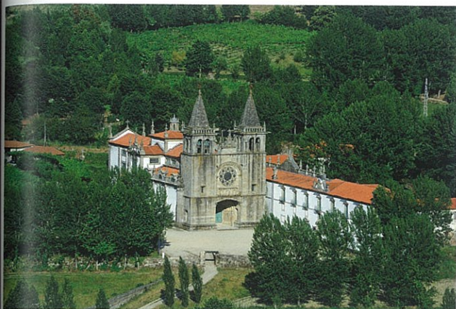
Mosteiro de Santa Maria de Pombeiro | Felgueiras