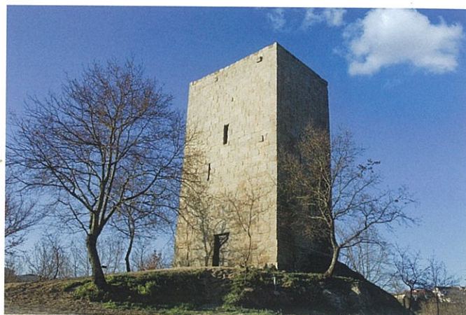
Torre de Vilar | Lousada

Acolhe, desde 2009, um dos Centros de Informação da Rota do Românico e, em 2015, no âmbito deste projeto, foram realizados trabalhos de conservação e restauro do órgão de tubos, inativo há dois séculos.