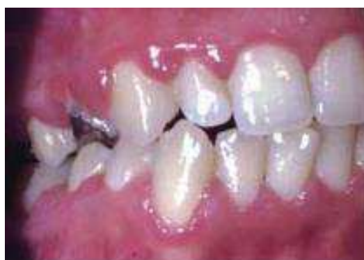
Figura 1- Gengivite gravídica (Giglio, Lanni, Laskin & Giglio, 2009)

progesterona e do estrogénio. Contudo, esta situação é localizada, reversível ou generalizada. Em termos clínicos, esta complicação está associada a uma vermelhidão nas gengivas, bem como a uma textura superficial brilhante e lisa, não sendo muito diferente da gengivite numa mulher não grávida. É precisamente a acumulação dos glóbulos vermelhos que torna a gengiva avermelhada e com sangramento, podendo, inclusive, formar edemas com papilas hiperplásicas. Caso esta situação não seja tratada, o processo patológico tende a afetar os tecidos duros, evoluindo, portanto, para uma periodontite (Louro, Fiori, Steibel & Fiori, 2001).