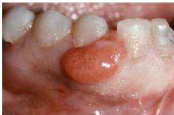
Figura 3- Aparência de um tumor gravídico (Silk et al., 2008)

uma taxa de incidência superior a 5% durante a gravidez (Silk et al., 2008). Basicamente, esta lesão surge enquanto resposta exacerbada numa área localizada, sendo, geralmente, assintomática. Porém, a escovagem dentária pode acabar por traumatizar a lesão, causando, inclusive, algum sangramento. Regra geral, esta lesão surge no terceiro mês de gravidez, apresentando características histológicas similares às do granuloma piogénico e possuindo uma aparência de amora, devido sobretudo ao seu aspeto granuloso e à sua cor vermelha escura. Esta lesão surge mais frequentemente na zona gengival anterior do maxilar superior, caracterizando-se enquanto lesão de tipo hiperplásico, ainda que benigna (Bulhosa, 1998; Guzman & Suárez, 2004; Aleixo, Moura, Almeida, Silva & Moreira, 2010).