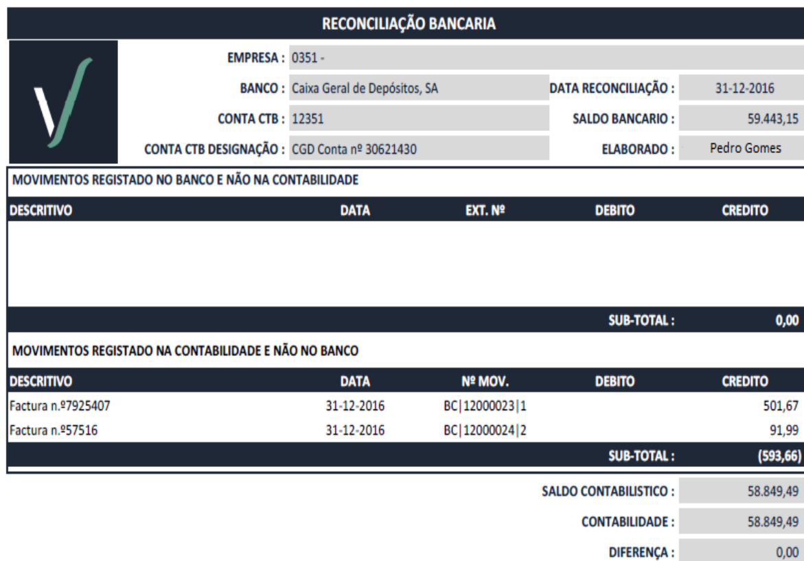
Figura 11 - Reconciliação Bancária - Extrato da contabilidade de um cliente após a reconciliação bancária.