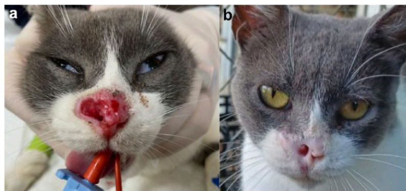
Figura 3: Gato 18 do estudo de Ferrer-Jorda e Rodrigues-Pizà (2024). (a) Antes do tratamento; (b) Resposta completa 223 dias após o tratamento.