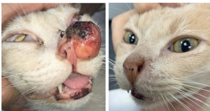
Figura 1: Gato do estudo de Tellado et al. (2022).