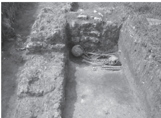
Figura 3 – Sondagem arqueológica a Norte do fórum, zona preferencial de desenvolvimento da investigação arqueológica em Conimbriga na actualidade.

b) Naturalmente, um dos elementos essenciais na estratégia de desenvolvimento do projecto de Conimbriga assenta na investigação arqueológica do núcleo urbano: o seu contributo permite a exposição de novas áreas ao público, enriquece o acervo museológico da instituição, promove a consciência pública sobre o local e aumenta o prestígio científico e académico da instituição. A investigação é, portanto, um pivot fundamental da actividade do Museu (Figura 3).