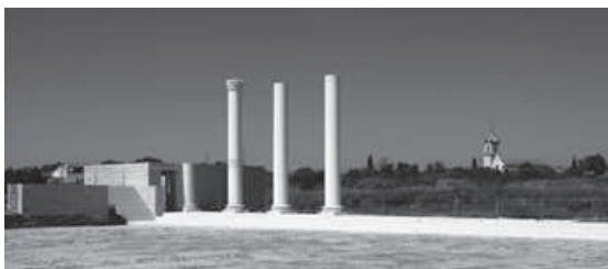
Figura 4 – Intervenção de conservação e valorização no fórum de Conimbriga (Projecto Cruz & Alarcão 1994).

– tratar, do ponto de vista arquitectónico, as coberturas de protecção dos vestígios pré-romanos e a sua relação com os monumentos flavianos, dando a estes a necessária expressão plástica; o exemplo da cobertura da Casa dos Repuxos, na medida em que estabelece um corte com a sua envolvente patrimonial e natural, é bem demonstrativo da potencial perturbação à fruição e à leitura que esse tipo de soluções acarreta. Foi, portanto, indispensável encarar uma intervenção global nos monumentos, necessariamente adaptada às suas dimensões e ao seu carácter monumental intrínseco; a monumentalidade da intervenção foi, assim, de natureza propriamente programática e não é acidental;