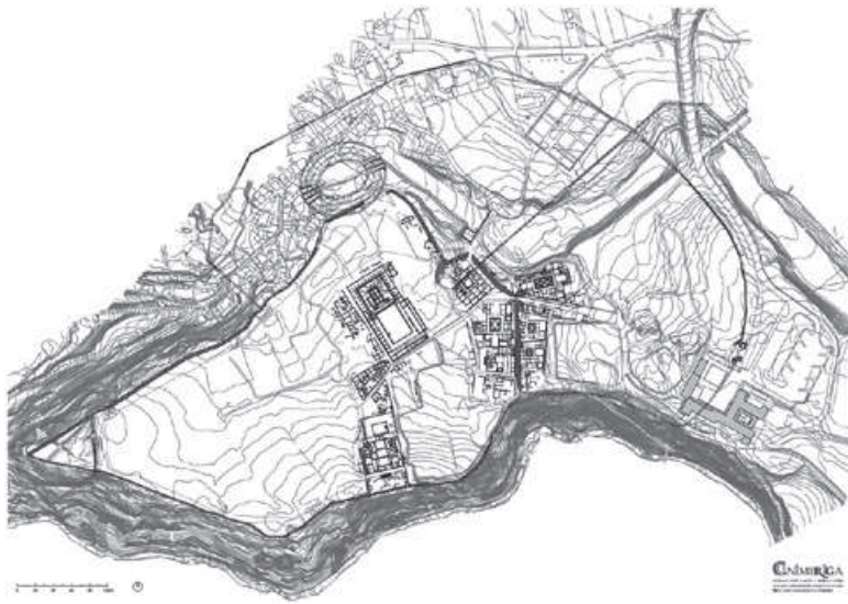
Figura 1 – Planta geral de Conimbriga, © Cruz & Alarcão – MMC/DGPC

actualmente, um dos problemas mais complexos em termos de gestão das ruínas. São bem claras as especificidades de um estabelecimento arqueológico ao ar livre, onde estão presentes estruturas construídas em alvenaria, revestimentos a estuque (por vezes ainda com pintura), pavimentos musivos, etc., sujeitos aos agentes atmosféricos e a amplitudes térmicas que ultrapassam por vezes os 30°C.