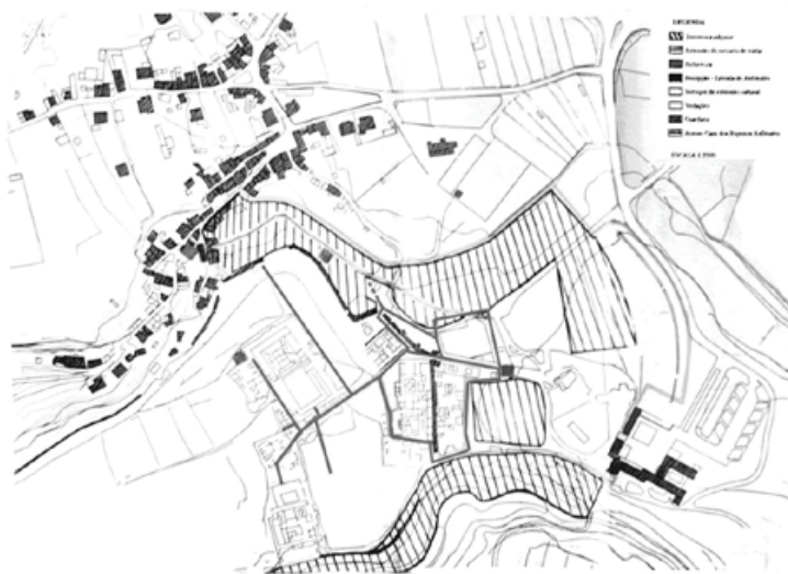
Figura 5 – Projecto de Desenvolvimento Infraestrutural do programa Museológico de Conimbriga. Planta de síntese.

a) a expansão do perímetro das Ruínas para os seus limites naturais, que correspondem aos limites antigos da cidade;