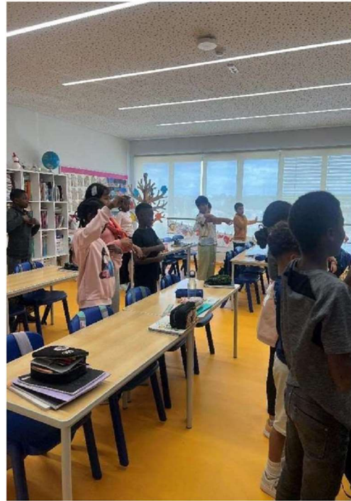
Figura 1 Movimento corporal ao som da música