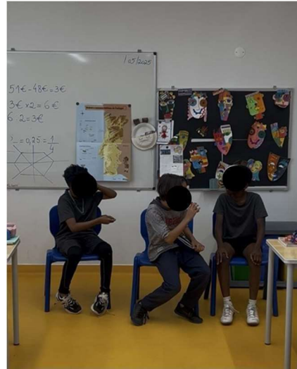
Imagem 2 - Dinâmica “Observo e sou observado”