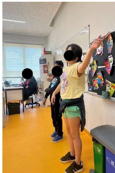
Figura 3 Movimento corporal a som da música