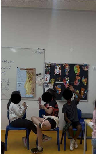
Imagem 1 – Dinâmica “Observo e sou observado”