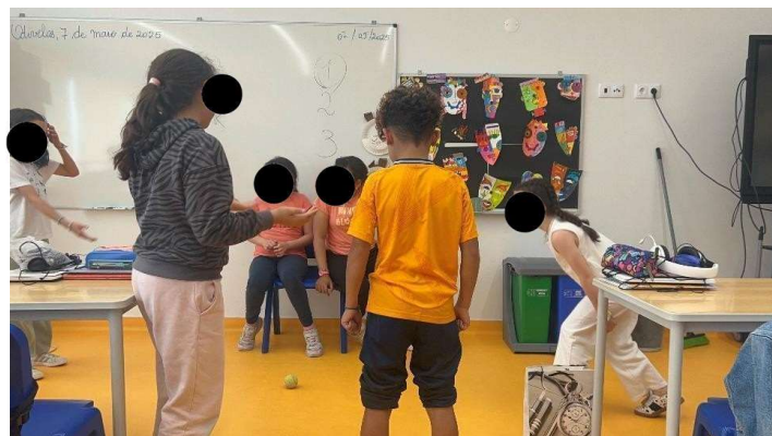
Figura 4 Dinâmica do exercício principal