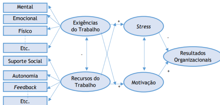
Ilustração nº 2: Job Demands-Resources Model (JD-R Model)