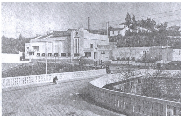
Fig. 1. Ponte sobre o Ave e Cineteatro Narciso Ferreira;

para a população aí viver e trabalhar, sem a necessidade de se deslocarem à sede do concelho. Em suma, esses edifícios suportavam as mais elementares necessidades humanas tais como: a habitação, a saúde, o ensino, a segurança pública, a cultura, a espiritualidade, o convívio, os serviços e comunicações, como também o comércio. Estamos assim na presença de um conjunto de equipamentos que só encontramos nas grandes cidades ou nas sedes dos concelhos. Riba de Ave, embora não sendo cidade nem sede de concelho, passou a conter um conjunto de infra-estruturas e equipamentos