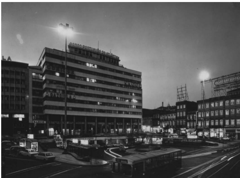
Figura 1. Praça D. João I, Porto, s.d. PT-FML-TR-PES-16-037.

por reprodução de fotografia analógica. A fotografia não conseguiu inicialmente alcançar o estatuto de documento, mas a sua reprodução e difusão a nível institucional, obrigou de certa maneira ao seu reconhecimento. A sua rápida difusão e consequente procura por parte de utilizadores, levou a que se focasse a atenção na digitalização e na recuperação da informação dos seus conteúdos através de termos descritores, originando pontos de acesso para a pesquisa.