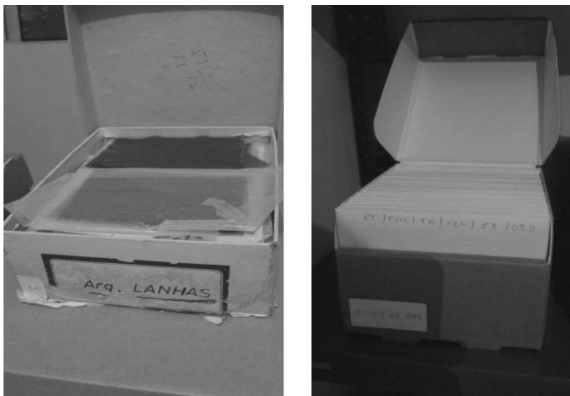
Figura 2 e 3. Unidade de instalação original, e após o novo acondicionamento das fotografias selecionadas. Fundo fotográfico Teófilo Rego.

como documentação textual associada (livros de registos, índices, etc.) ou, inclusive, informação recolhida da própria fotografia como carimbos, assinaturas ou datas. No caso do fundo fotográfico Teófilo Rego a informação relativa a cada imagem e a documentação textual associada é escassa. A descrição tem como objetivo sistematizar a informação mais pertinente relativa a cada imagem, e juntamente com a indexação facilitar a pesquisa por parte dos utilizadores. Optou-se por dar títulos auto-explicativos e objetivos, e o uso de linguagem controlada nos descritores relativos a pontos temáticos, geográficos ou nominativos, este último seguindo a norma ISAAR(CPF) 28 . No processo que leva à digitalização e difusão de milhares de imagens, é inevitável a necessidade da conservação e tratamento destes novos documentos digitais. A preservação digital consiste em garantir que a informação digital permanece acessível e com a qualidade de autenticidade para ser interpretada futuramente, recorrendo a uma plataforma tecnológica diferente da utilizada no momento da sua criação 29 . No presente caso as imagens estão a ser guardadas em formato Tiff, como já foi mencionado. Segundo Iglésias Franch 30 este formato será o mais indicado em termos de preservação digital, comparando com o Jfif, Jpeg2000 e Png. As imagens Tiff estão gravadas num disco externo, do qual é efetuada sempre uma cópia de segurança num segundo disco, a guardar em local fisicamente distinto do primeiro.