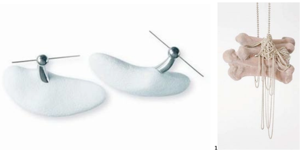
Fig.1 Brooch body de Christoph Zellweger, 1996

interagir, contribuindo, cada qual com a sua parte, para a construção de jóias, sendo estas portadoras de todas as influências já citadas, enriquecendo a sua carga simbólica e significativa. Desta interacção resulta um predomínio do corpo sobre a jóia e não o contrário. A jóia passa a ser parte integrante do corpo, como se fosse nele implantada. Para Zellweger, as jóias são simultaneamente atraentes e chocantes, tal como o podem ser os corpos por si só.