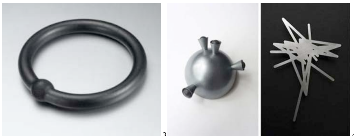
Fig.3 “Gold makes blind” de Otto Künzli, 1980

originalidade e trabalhadas meticulosamente, sendo rigorosamente escolhidos os materiais para sua realização, com o intuito de conferir à cada uma mensagem poderosa.