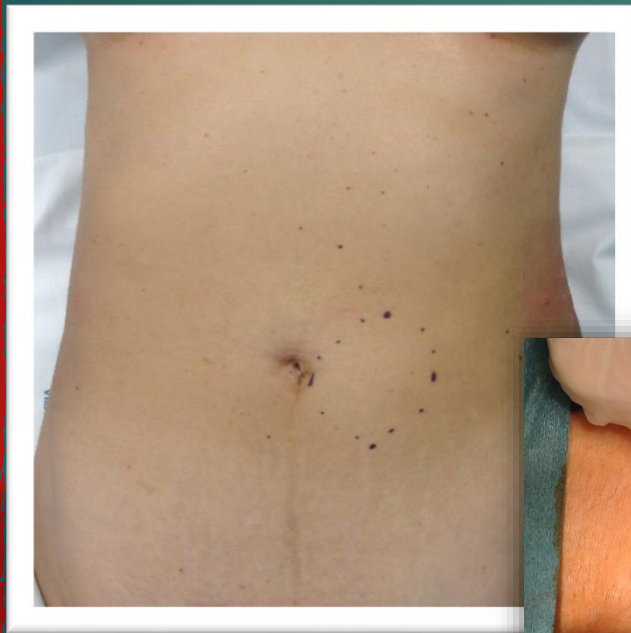
Figura 1– Pré-operatório