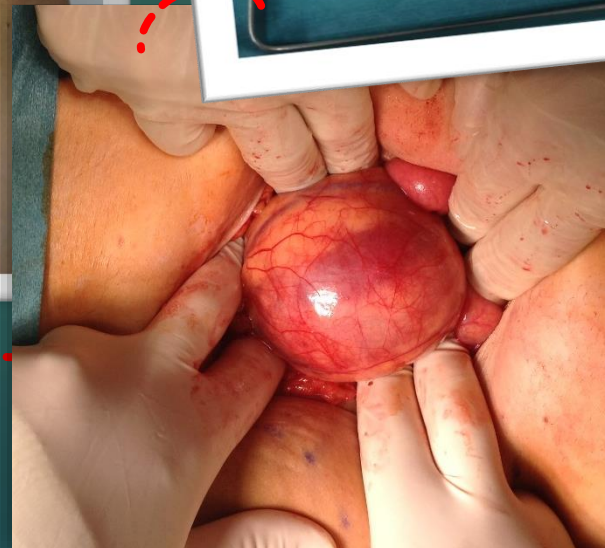
Figura 2– Laparotomia com exposição de tumor recoberto por retroperitônio