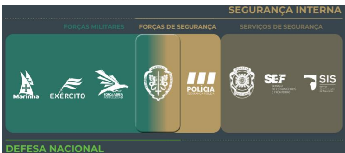
Figura 1 - Enquadramento da GNR enquanto força de segurança