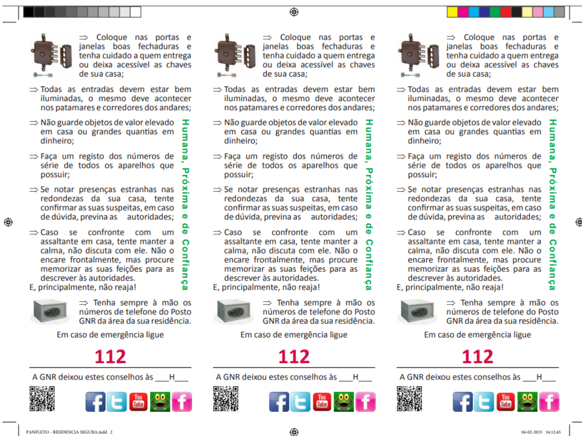
Figura 10 - Panfleto do PERS (2)