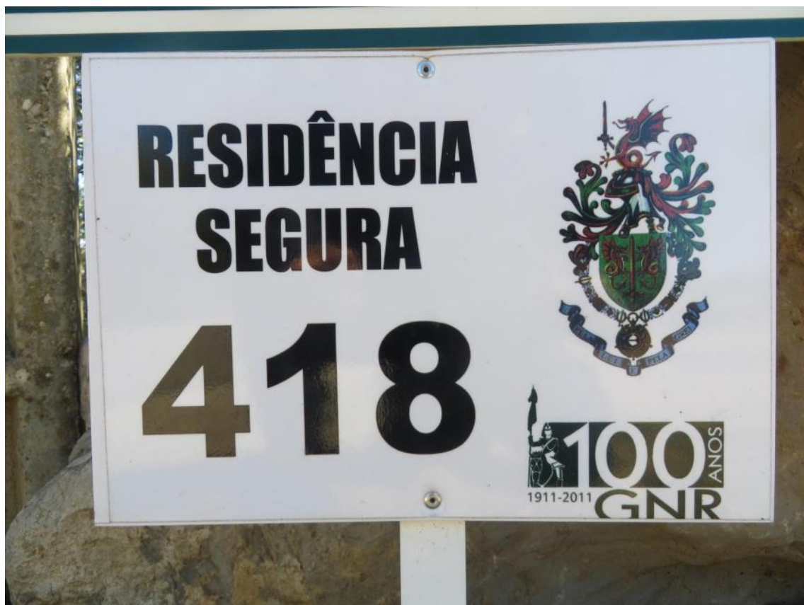
Figura 11 - Placa identificativa do PERS