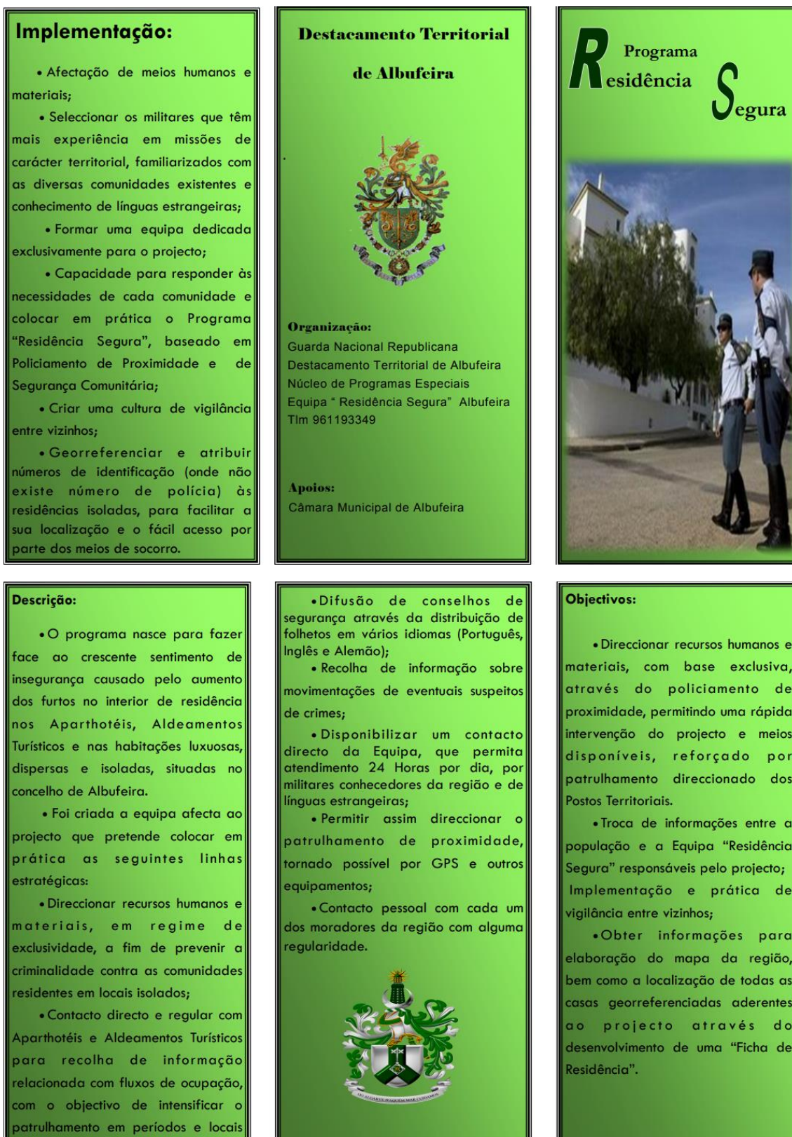
Figura 9 - Panfleto do PERS (1)