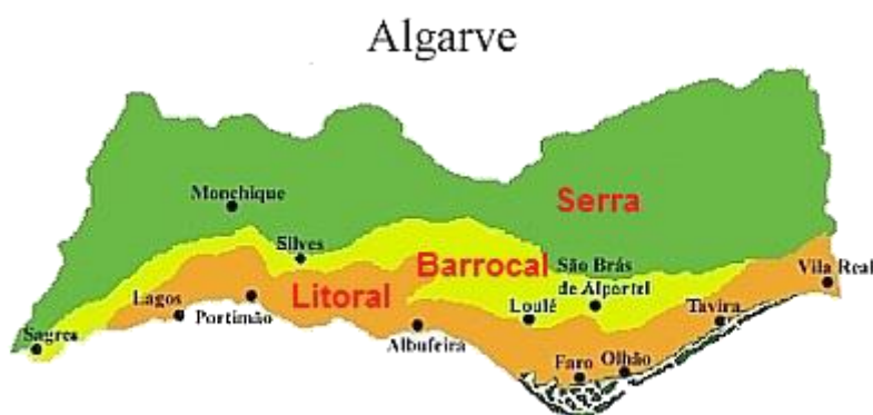
Figura 5 - Demografia do Algarve

O Programa Especial Residência Segura foi lançado pela GNR em Loulé em 2010, no seguimento de um grande aumento do número de roubos e furtos em residência, que incidia em locais isolados, principalmente afastados do Litoral e incidindo na zona do Barrocal, tendo como principal alvo moradores estrangeiros. Após discussão entre a GNR e os moradores sobre qual a melhor forma de responder a esta situação, surge a ideia de estreitar a relação entre o cidadão e a GNR e entre as próprias pessoas, numa noção de comunidade, para que mais facilmente se relatasse algo de estranho e que os moradores se protegessem. Para este fim o DTer de Loulé cria uma equipa constituída por militares fluentes em inglês para desenvolverem o programa, na altura projeto, sendo estes militares pertencentes das SPCPC, pelo que já tinham conhecimentos nas áreas do policiamento de proximidade e comunitário (Safe Communities Portugal, 2022).