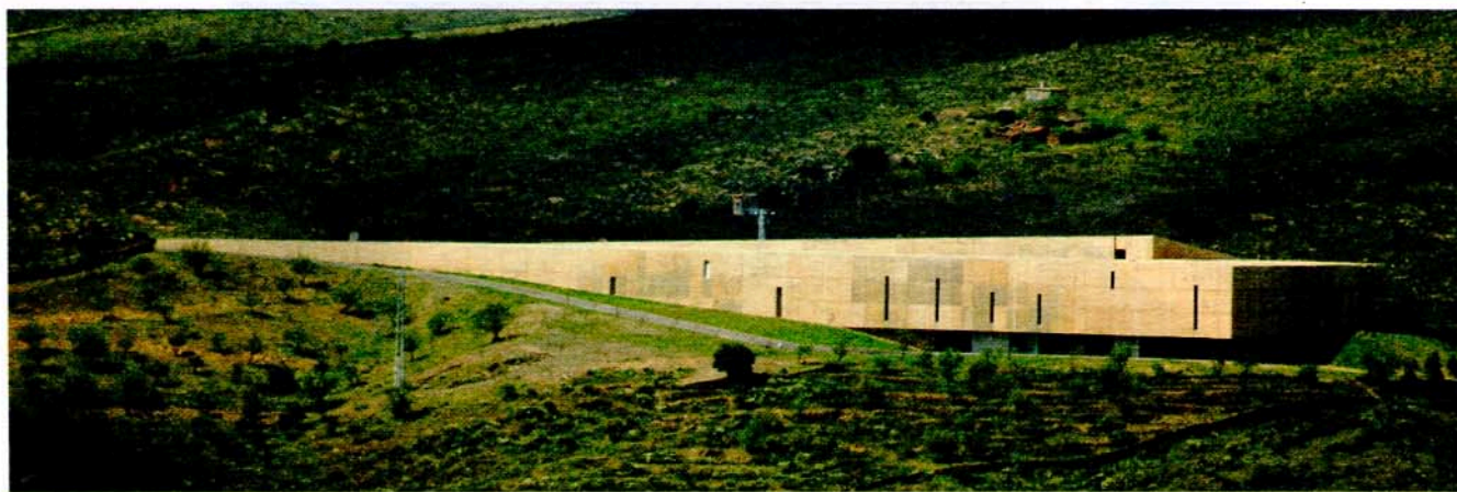
Aspecto geral do Museu do Côa

Para além dos dois Patrimónios Mundiais (Arte Rupestre do Vale do Côa e Douro Vinhateiro), Vila Nova de Foz Côa e os concelhos envolventes possuem riquezas naturais, agrícolas, cinegéticas, paisagísticas, desde logo vinhos e azeites de qualidade mundial, mel, figos, amêndoa, produtos lácteos, mas também património imaterial e património construído, do qual se destacam as vias romanas, as igrejas manuelinas e barrocas, os pelourinhos medievais, as aldeias do Côa, os castelos de Longroiva, Marialva, Trancoso, Castelo Rodrigo, Sortelha e ainda outros como o de Numão e de Castelo Melhor (que esperam intervenção e estudo), os solares oitocentistas, os miradouros e os núcleos museológicos de Freixo de Numão, Meda, etc.