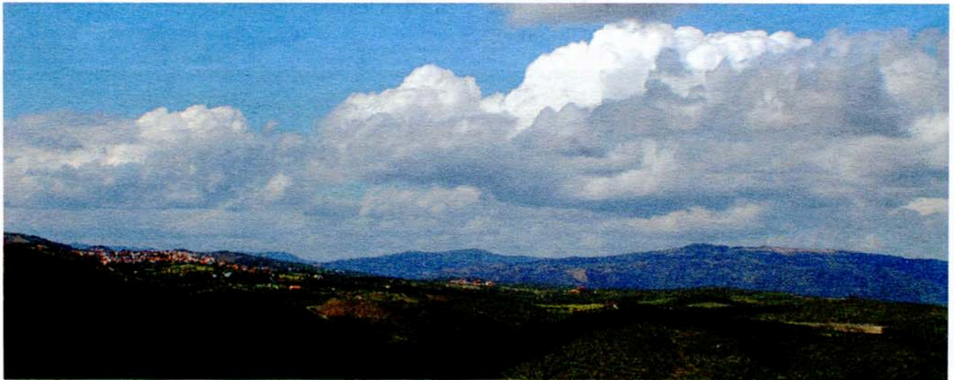
Vila Nova de Foz Côa e o Museu

É aqui que a Associação dos Amigos do Parque e Museu do Côa pode dar o seu contributo fundamental!