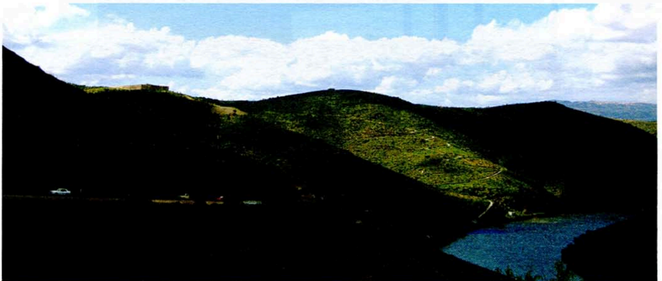
O Museu do Côa sobranceiro ao rio Douro (Do museu ao rio Douro distam apenas 550 metros)

Não se podem assacar responsabilidades apenas à Administração Central, nem continuar à espera que o Governo Central ou Local resolva todos os "nossos" problemas. É indispensável que estas entidades públicas se entendam com o tecido