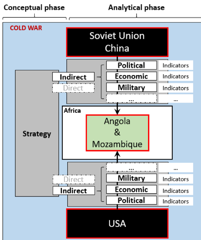
Figura 2 – Modelo de análise e estrutura do artigo

Por fim, a abordagem indireta pode ser considerada no patamar: (1) da grande estratégia, que considera a coação económica, diplomática, política e da força militar; e (2) da estratégia operacional, que remete para a aplicação indireta do instrumento militar, que, por sua vez, está dependente da surpresa, da flexibilidade, da velocidade e da decepção para alcançar efeitos físicos e psicológicos sobre um inimigo ou adversário 42 . Desta forma, consolidando os aspetos referidos na primeira parte, pode-se avançar com um modelo de análise para responder à questão formulada. Na Figura 2 apresentam-se as duas fases de tratamento da investigação (conceitual e analítica) que refletem a procura de indicadores que evidenciam o recurso a uma abordagem indireta pelas grandes potências, em Angola e Moçambique. A abordagem será analisada no patamar da grande estratégia, ou seja, no contexto dos instrumentos de coação político, económico e militar.