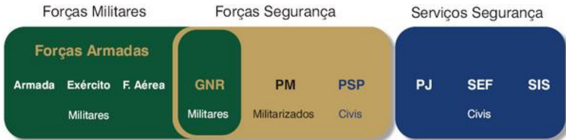
Ilustração n.º 24 – Enquadramento da GNR no Sistema de Forças Nacional.