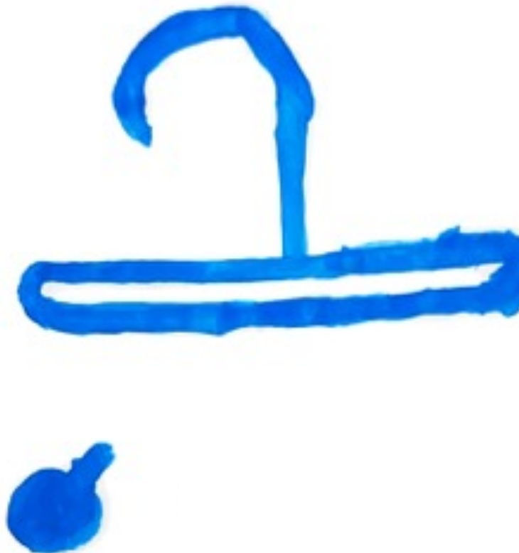
Figura 5 - A Mudança, desenhado pelo participante A