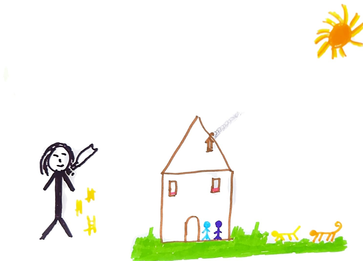
Figura 6 - A Origem do Problema, desenhado pela participante H

A origem do problema. é Raiva que ficou fechada durante muito tempo e que de uma vez foi explodir e me magoou. é quando nós não estamos bem. Estamos presas na maldade. Estamos focadas muitas vezes em coisas que nos magoa. Para mudar isso temos que nos concentrar nas coisas boas. Todas nós temos Raiva cada um tem Raiva a sua maneira a minha é fazer mal a mim própria.