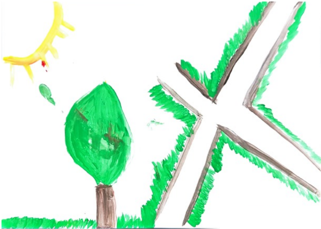
Figura 4 - A Mudança, desenhado pela participante C