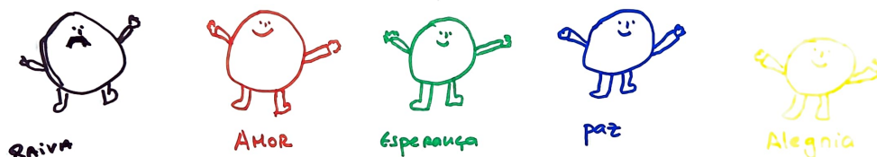
Figura 7 – A Origem do Problema, desenhado pela participante G

A origem do problema. é Raiva que ficou fechada durante muito tempo e que de uma vez foi explodir e me magoou. é quando nós não estamos bem. Estamos presas na maldade. Estamos focadas muitas vezes em coisas que nos magoa. Para mudar isso temos que nos concentrar nas coisas boas. Todas nós temos Raiva cada um tem Raiva a sua maneira a minha é fazer mal a mim própria.