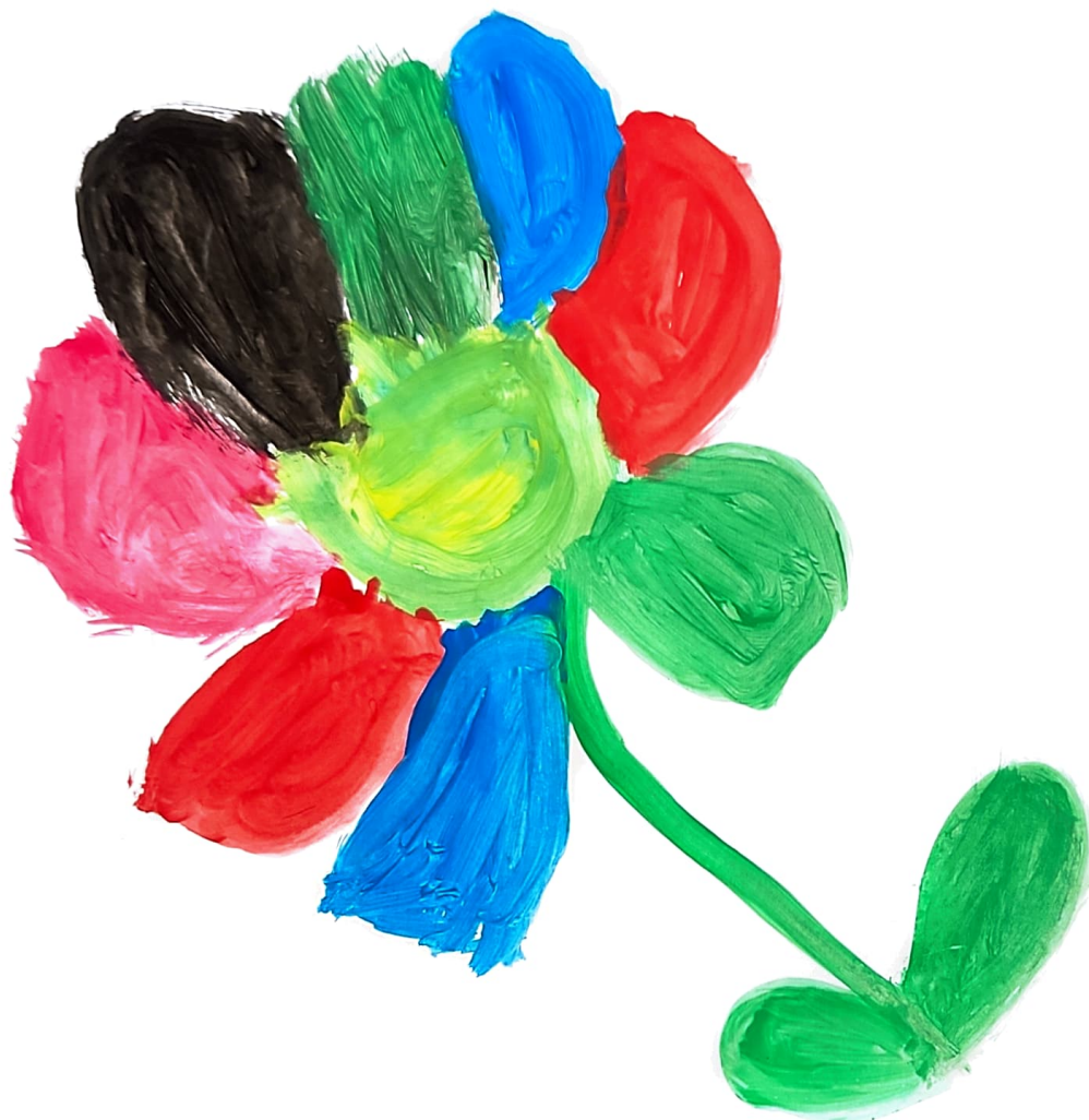
Figura 9 - A Mudança, desenhado pela participante J

O trabalho com este grupo também foi muito enriquecedor. Para além de ser composto por elementos com características muito distintas foi muito interessante o trabalho desenvolvido.