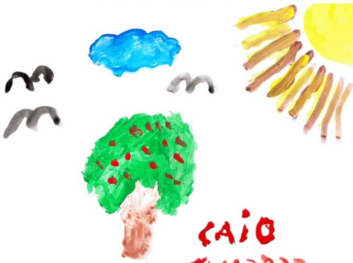
Figura 3 - A Mudança, desenhado pelo participante D

muito recetivos aos nossos desafios, procurando realizar os trabalhos de casa entre sessões e manifestando desenvolvimento da autoconsciência e definição de objetivos futuros. De uma maneira geral, os participantes tinham expectativas muito baixas acerca da intervenção com a utilização dos MA-E, mas que durante as sessões sentiam bem-estar e alívio pela partilha de sentimentos conseguindo esquecer durante aquele momento os pensamentos negativos e as ideias ruminantes. Foi referido por uma das participantes que um dos aspetos mais positivos da intervenção é realizar-se em grupo. Todos eles manifestaram vontade em continuar com as sessões e recomendaram a outras pessoas na mesma situação.