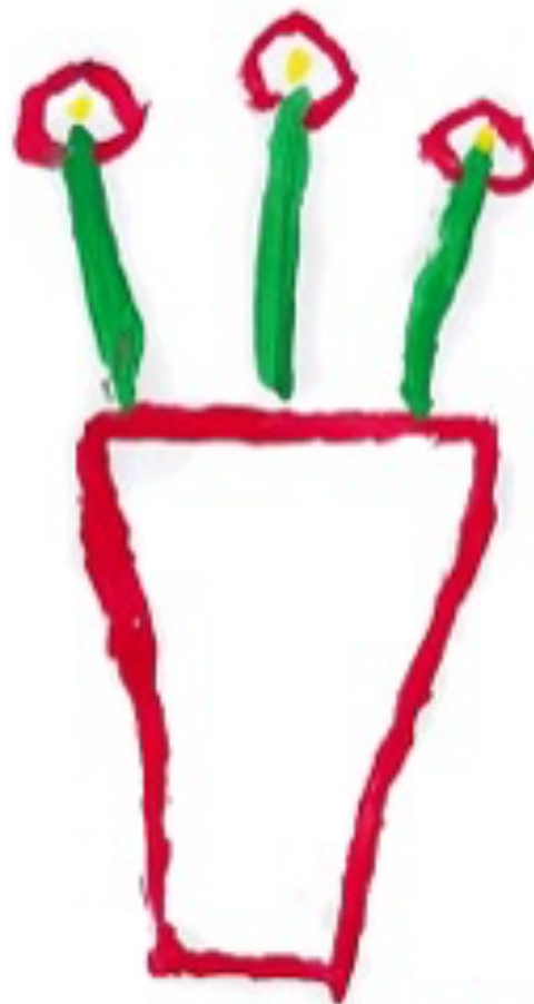
A Mudança, desenhado pela participante E

Apesar de ter sido o grupo que sentimos maior dificuldade numa fase inicial, sentimos que ao longo da implementação deste projeto estabeleceu-se uma boa relação de confiança entre enfermeiro-utente. Com alguns elementos em particular mostraram-se