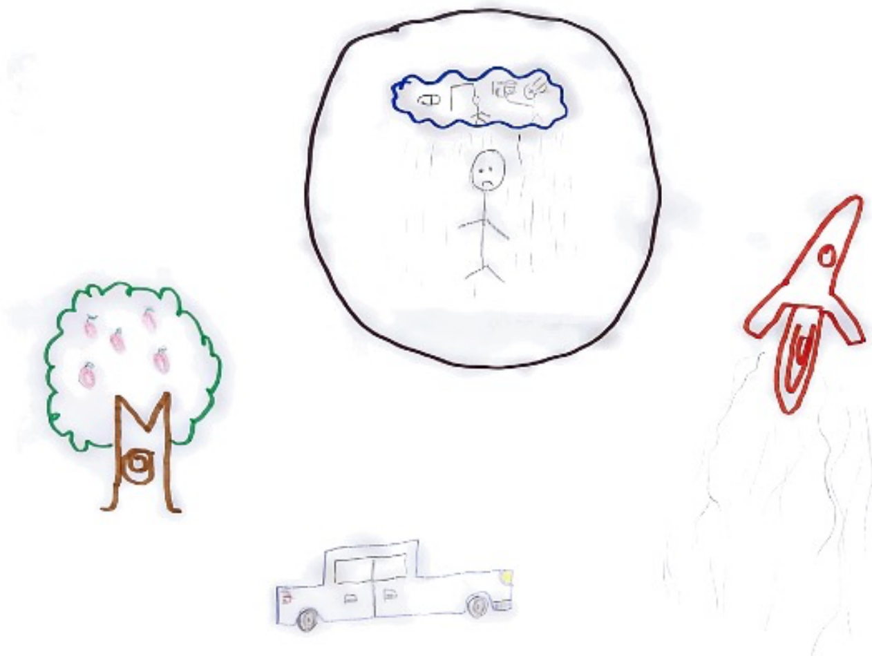
Figura 1 – A Origem do Problema, desenhado pelo participante D

Relativamente ao desenho que fez referente ao tema “A Origem do Problema” o participante D disse: vou explicar o simbolismo do meu desenho – no centro estou eu, com os meus pensamentos suicidários, estou envolto por este círculo a preto, que representa a minha depressão e que me impede de aproveitar a vida e todas as coisas boas que estão disponíveis à minha volta. O que me pode ajudar? Medicação associado ao apoio da minha família e a algumas terapias que posso frequentar.