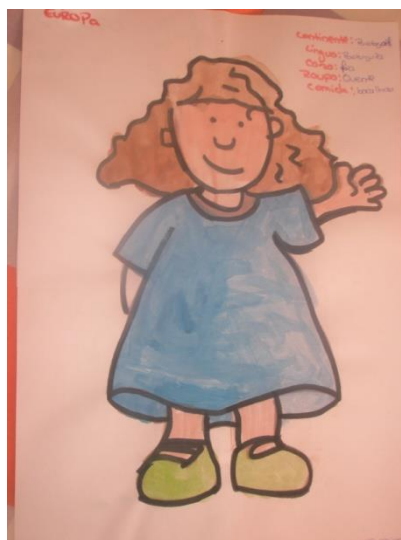
Imagem 5 – A Europa