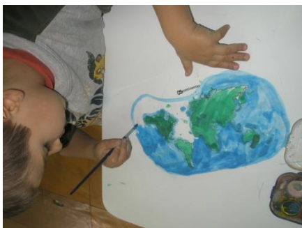
Imagem 1 – Pintura do mapa

peças dos cinco continentes. Para dar continuidade à atividade solicitei às crianças individualmente que se sentassem em redor de uma mesa comigo e que me dissessem qual era o nome do continente que eu apontava. Para terminar cada criança desenhou uma pessoa em cada continente, de acordo com as características físicas da mesma (Imagem 2 e 3). Pedi que as crianças do grupo dos cinco anos escrevessem os nomes dos continentes, enquanto no trabalho das restantes crianças fui eu que escrevi.