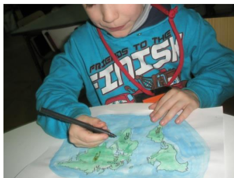
Imagem 2 – Escrita do nome do continente