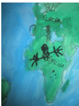
Imagem 3 – Desenho do menino do respetivo continente