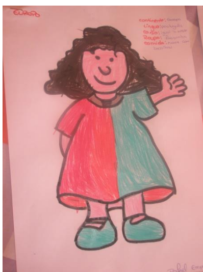
Imagem 4 – A Europa

Iniciou-se a atividade com a leitura da história “A Rita de Portugal”. De um modo sucinto a história consistia em apresentar a cultura de Portugal, nomeadamente a gastronomia, o vestuário de verão e de inverno e o tipo de habitação. Posteriormente fiz algumas perguntas relacionadas com a mesma, nomeadamente: “Qual era a comida que a Rita costumava comer?”, “O que costumava fazer a menina durante o dia?”, “Onde morava?” e “Qual era o vestuário típico daquele país?”. Algumas crianças responderam corretamente enquanto outras confundiam com a história da Ásia. Após isto distribuí por cada criança um desenho sobre a menina e pedia-lhes para pintarem. Após todas as crianças pintarem sentei-me em redor de uma mesa, com cada criança, individualmente, e fiz um pequeno questionário. À medida que a criança me ia respondendo eu ia escrevendo ao lado do desenho. Isto foi feito com todas as crianças (Imagem 4 e 5).