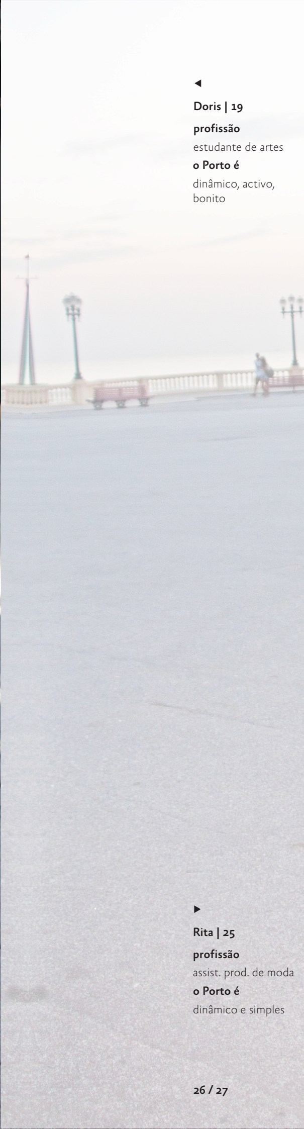
▶ Rita | 25 profissão assist. prod. de moda o Porto é dinâmico e simples