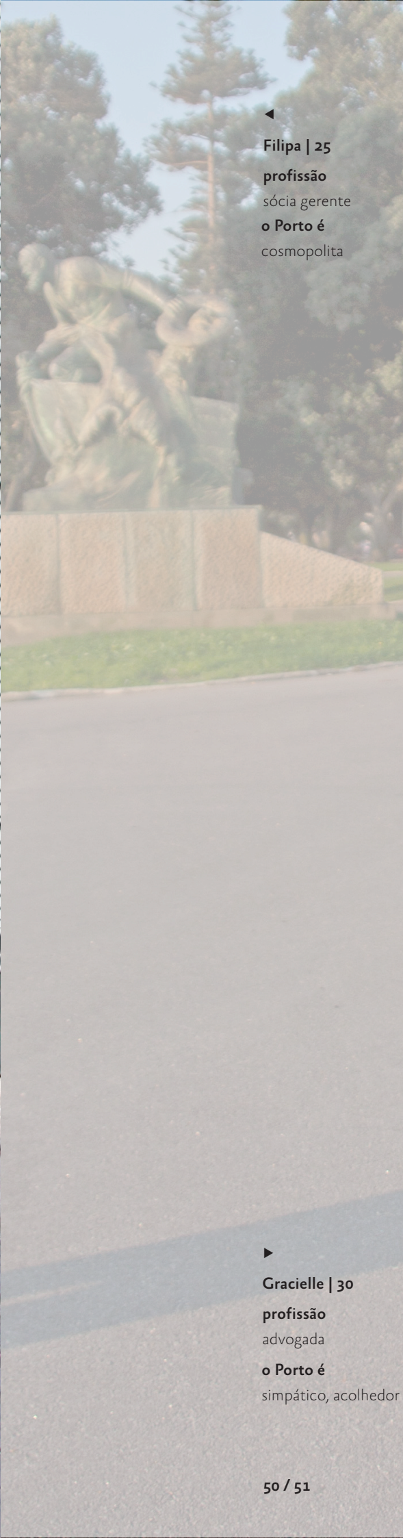
◀ Filipa | 25 profissão sócia gerente o Porto é cosmopolita