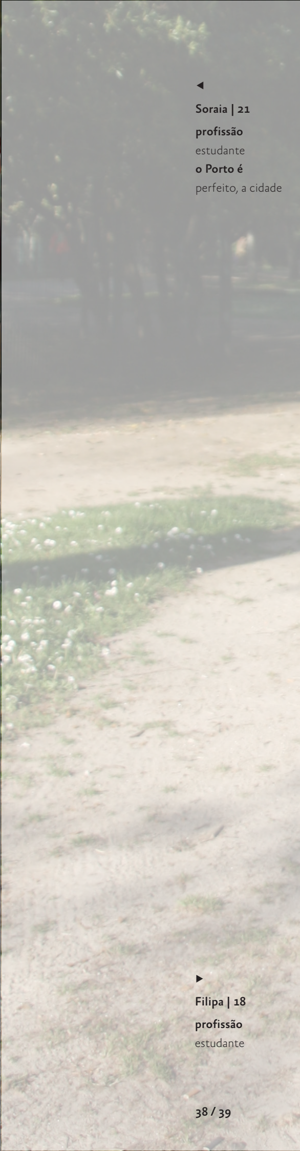
▶ Filipa | 18 profissão estudante