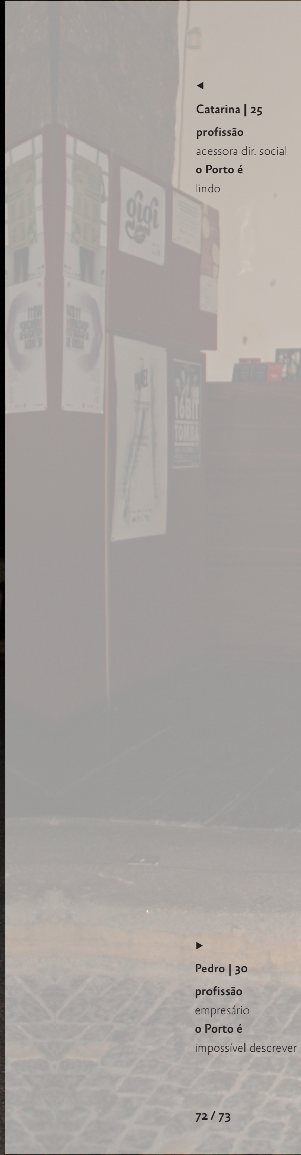
▶ Pedro | 30 profissão empresário o Porto é impossível descrever