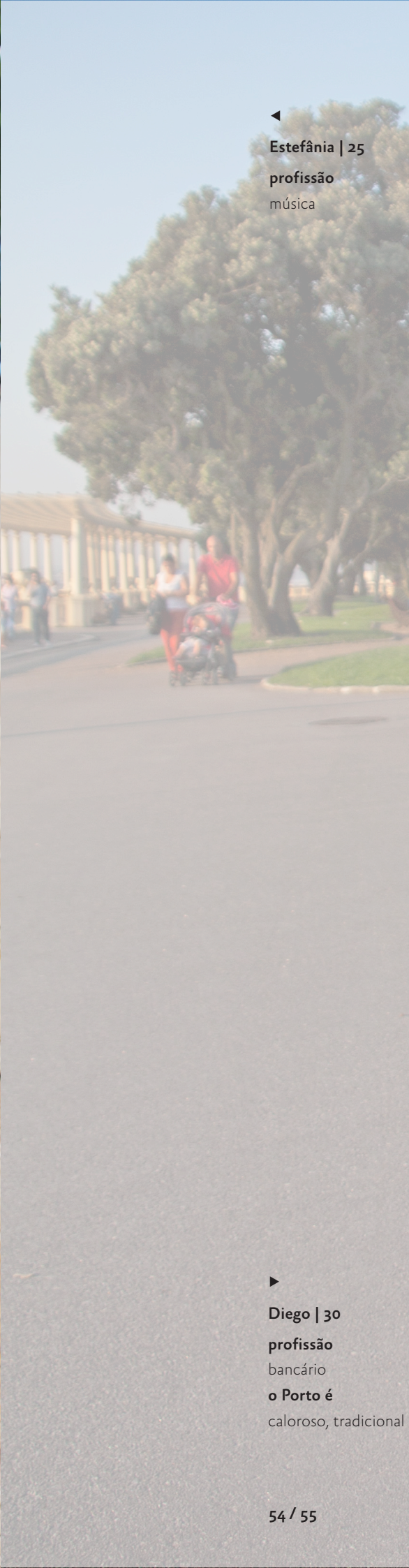
▶ Diego | 30 profissão bancário o Porto é caloroso, tradicional