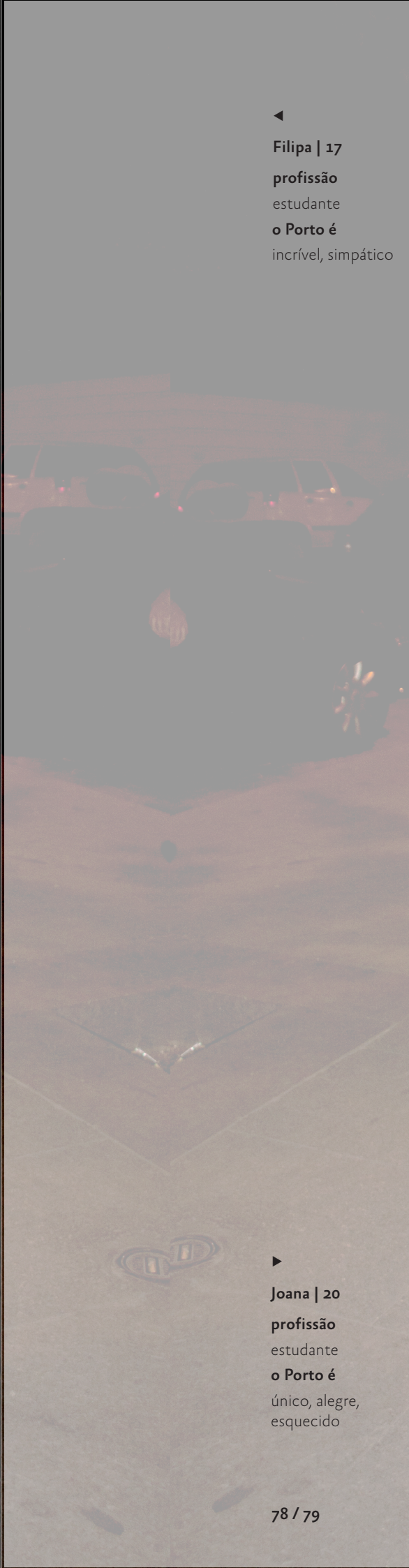
◀ Filipa | 17 profissão estudante o Porto é incrível, simpático