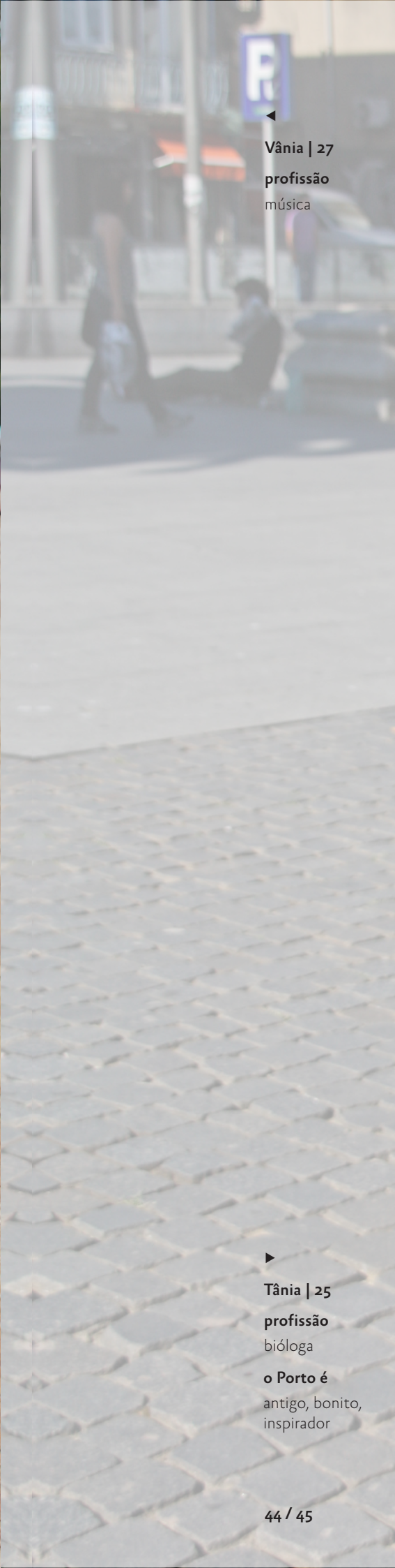
◀ Vânia | 27 profissão música