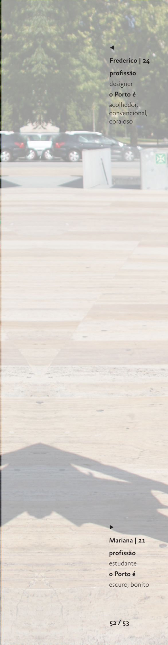
▶ Mariana | 21 profissão estudante o Porto é escuro, bonito