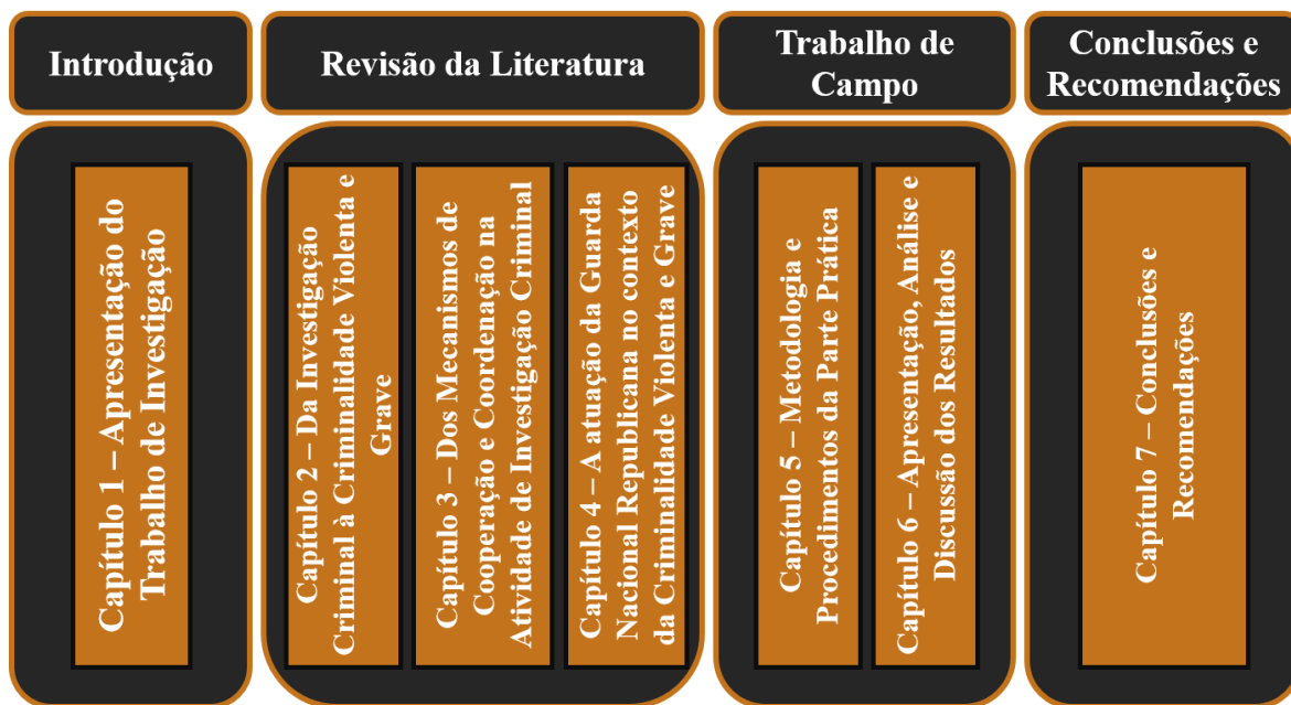
Figura n.º 2 - Estrutura do Relatório Científico Final do Trabalho de Investigação Aplicada