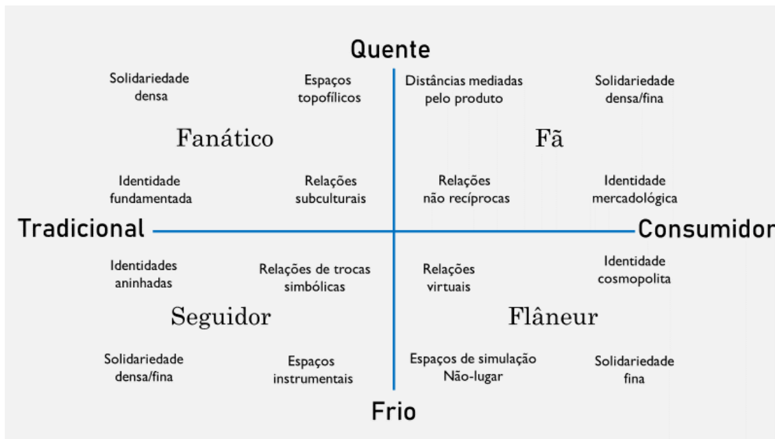
Figura 2 Modelo taxionómico das identidades do espetador contemporâneo. Adaptado de “Fanáticos, seguidores, fãs e flâneurs: uma taxonomia de identidades do torcedor no futebol”, de R. Giulianotti, 2012, Recorde: Revista de História do Esporte , 5, p. 31.