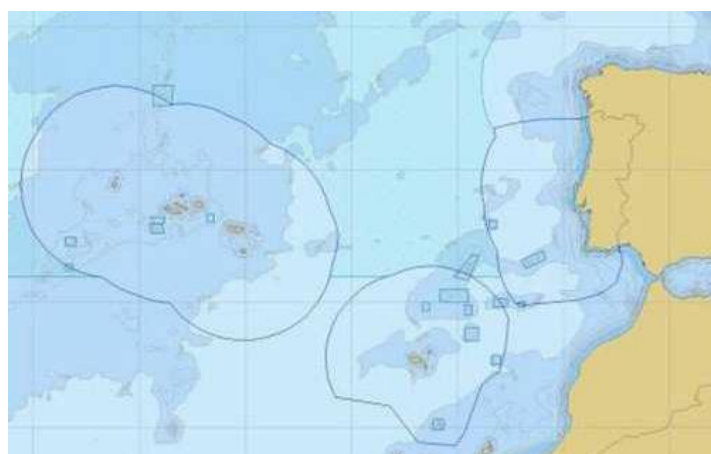
Figura 1- Zona Económica Exclusiva (PDSO, 2012)

Na figura abaixo são representados os limites da ZEE.