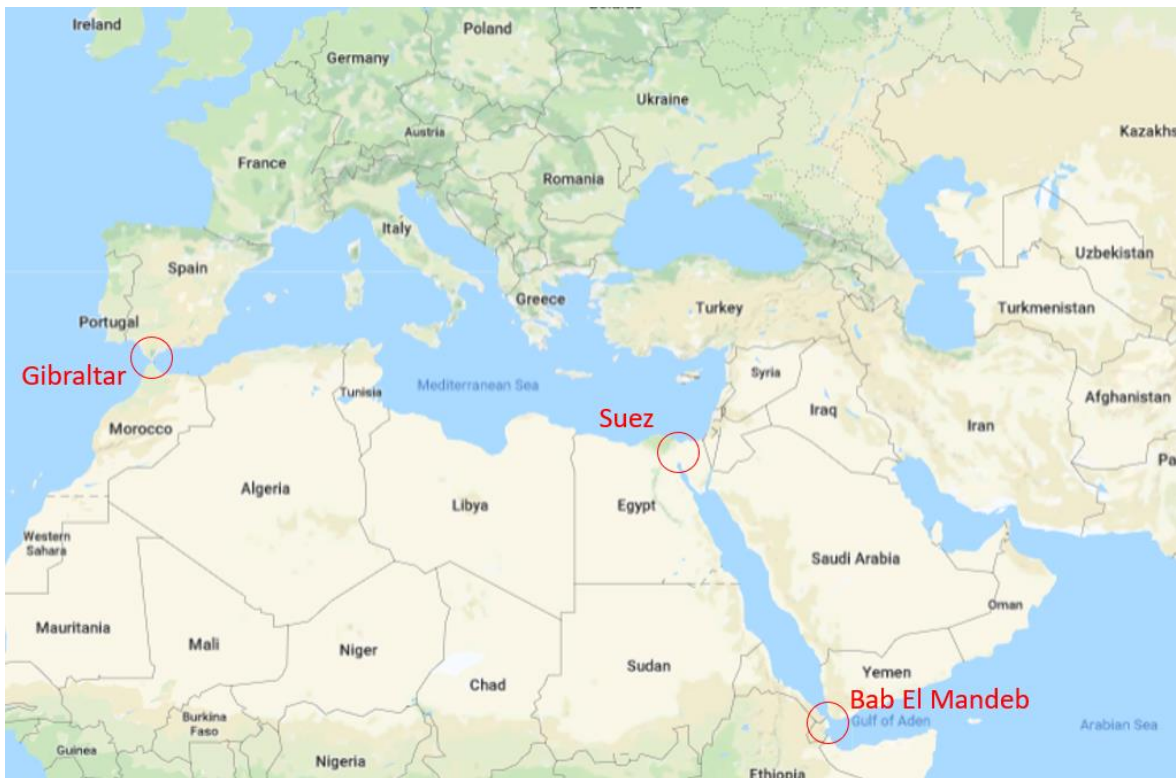
Figura 2 – Mar Mediterrâneo e pontos de acesso

A importância do Mediterrâneo não é essencial só para a UE, na verdade, é um mar central e global. Tal como pode ser observado na Figura 2 esta centralidade estratégica só é possível devido a dois chokepoints de extrema importância: o Estreito de Gibraltar e o Canal do Suez (Seiti, 2017). O Estreito de Gibraltar encontra-se no extremo oeste do Mediterrâneo. O Canal do Suez encontra-se a sudeste do Mediterrâneo constituindo a comunicação com o Mar Vermelho. Se por um lado o Estreito de Gibraltar goza hoje de uma segurança relativa, no caso do Canal do Suez a complexidade é maior. Para que esta passagem seja segura é necessário garantir a segurança do próprio canal, do Mar Vermelho, do Estreito Bab El Mandeb (outro chokepoint ) e do Golfo de Adem, tendo a UE vindo a efetuar um grande esforço ao longo dos últimos anos para garantir a segurança marítima nestas áreas, em cooperação com a North Atlantic Treaty Organization (NATO).