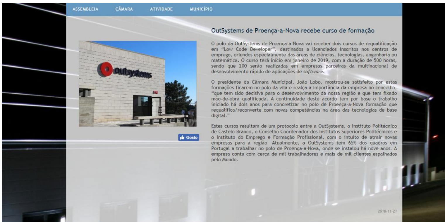
Imagem 3 - Captura de ecrã "OutSystems de Proença-a-Nova recebe curso de formação"