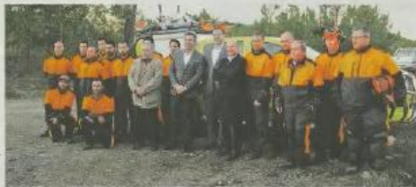
Intermunicipal da Beira Baixa (CIMBB).

O governo anunciou-se a Póvoa-a-Nova, para acompanhar o trabalho desenvolvido pela primeira brigada de sapadores florestais da Comunidade