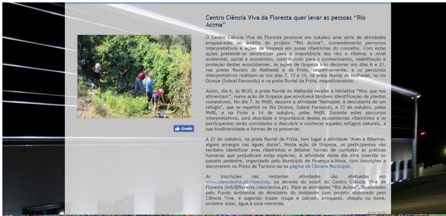
Imagem 2 - Captura de ecrã do site municipal sobre "Centro Ciência Viva da Floresta quer levar pessoas "Rio Acima"