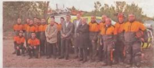
O secretário de Estado esteve acompanhado pelas presidentas de câmara de Proença-a-Nova e Oleiros.

19 brigadas de sapedores florestais vão fazer, este ano, a limpeza das faixas de rede primária em 1.500 quilómetros