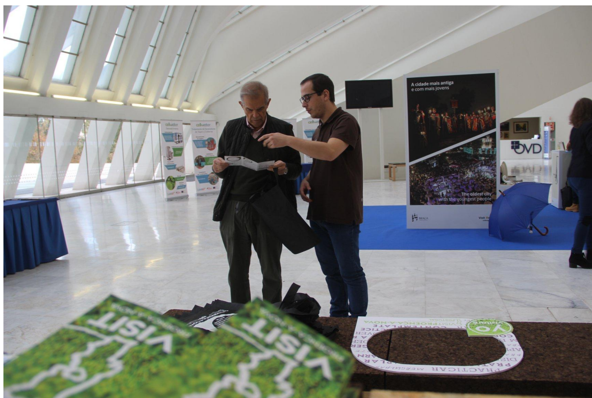
Imagem 5 – Ação de divulgação no stand da Câmara Municipal de Proença-a-Nova na Feira "Sentir Portugal" em Oviedo