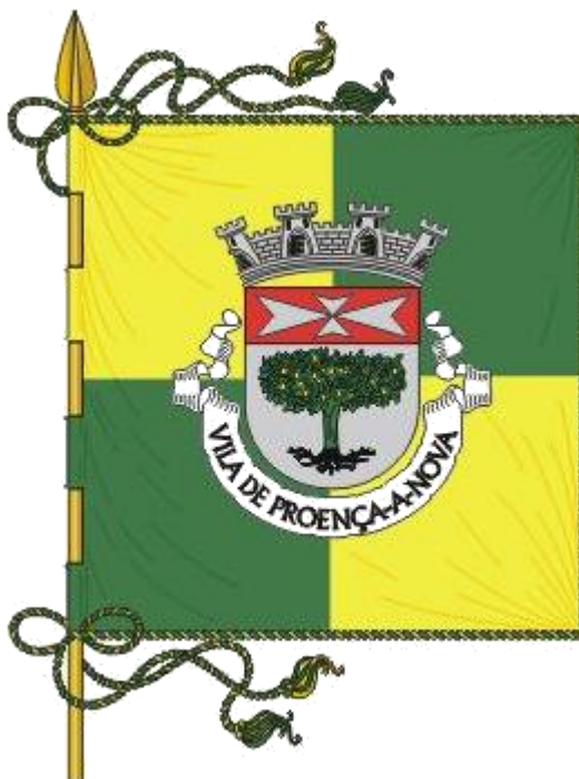
Figura 1- Bandeira da Vila de Proença-a-Nova.

Segundo dados da Pordata 3 , registava em 2018, 7.448 habitantes. Tem uma área de 395,40 km 2 e está subdividido em quatro freguesias: Montes da Senhora, Proença-a-Nova e Peral, São Pedro do Esteval e Sobreira Formosa e Alvito da Beira. O concelho é limitado a norte pelo município de Oleiros, a nordeste pelo de Castelo Branco, a este pelo de Vila Velha de Ródão, a sudoeste pelo de Mação e a noroeste pelo da Sertã.