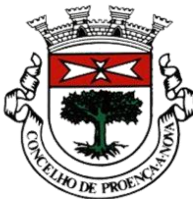
Figura 2 - Brasão do Concelho de Proença-a-Nova.