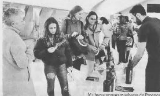
Milhares provarão sabores de Proença

Somou um território com poucas pessoas, mas vindo de um seithler com um património cultural e