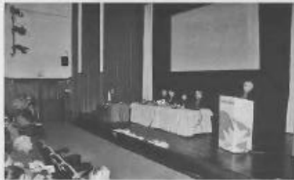
Movimento da Mensagem de Fátima

O Conselho Diocesano reelegue Presidente do Secretariado do Movimento da Mensagem de Fátima ativo na diocese de Portalegre-Castelo Branco reuniu em Conselho Diocesano no pp 5 de Janeiro, no auditório municipal de Proença-a-Nova. Os 80 mensageiros, dos quais cerca de uma dezena de jovens, representantes da quase totalidade dos 37 Grupos de Acção Paroquial, fizeram avaliação pastoral do ano lido e balanço do exercício do Secretariado diocesano no triénio 2015-2018 e aprovou a proposta de Plano