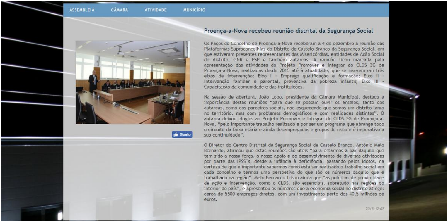
Imagem 1 - Captura de ecrã do site municipal sobre "Proença-a-Nova recebeu reunião distrital da Segurança Social"