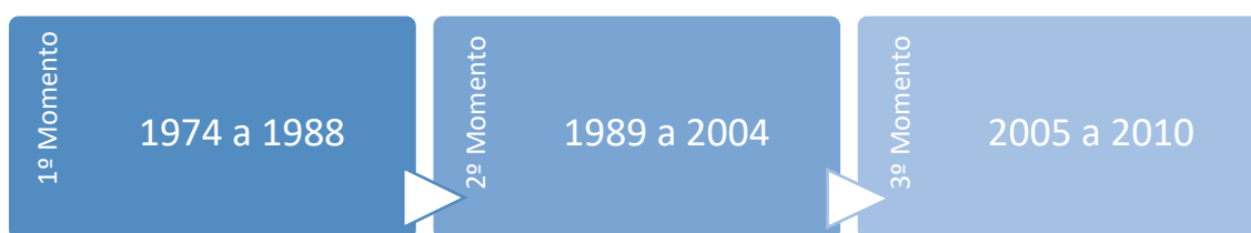
Figura 1- Evolução do Normativo Contabilístico Português segundo Gomes & Pires, 2010

Segundo Gomes & Pires (2010), a evolução do normativo contabilístico português pode ser destacada em três momentos: