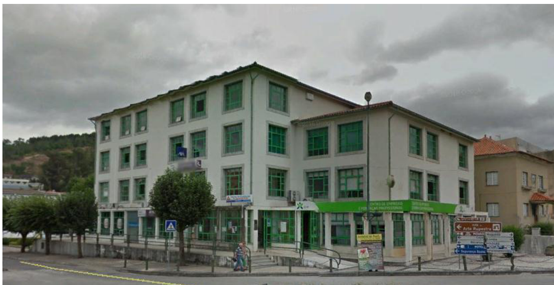
Figura 1 - Edifício da Entidade

Capital Social € 5.500,00, distribuídos de forma equitativa por dois sócios.