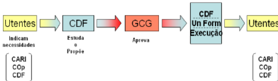
Figura 4.2: Fluxo de Formação Interna.