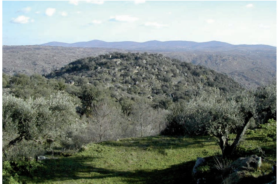
fig. 2 Colina do Castelo dos Mouros visto de ocidente.