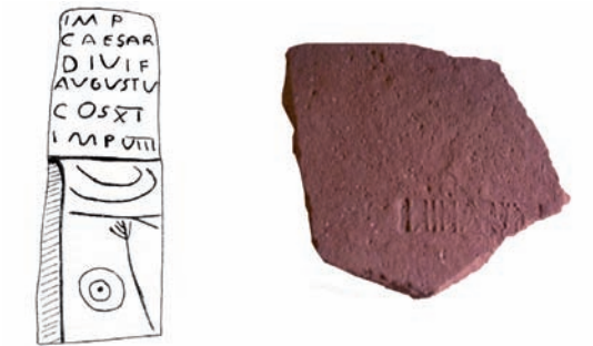
fig. 7 Estela de Argomil.