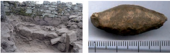
fig. 5 Castelo dos Mouros. Muralha no Sector I.