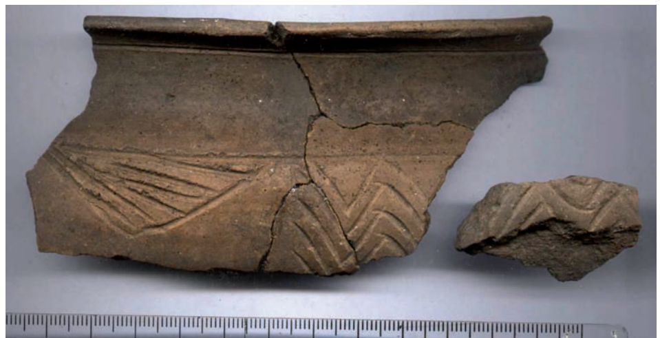
fig. 4 Cerâmica decorada do Sector III.