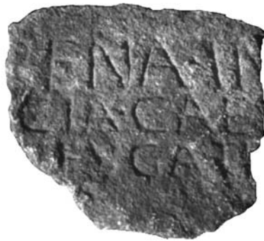
fig. 10 Inscrição do Castelo dos Mouros.