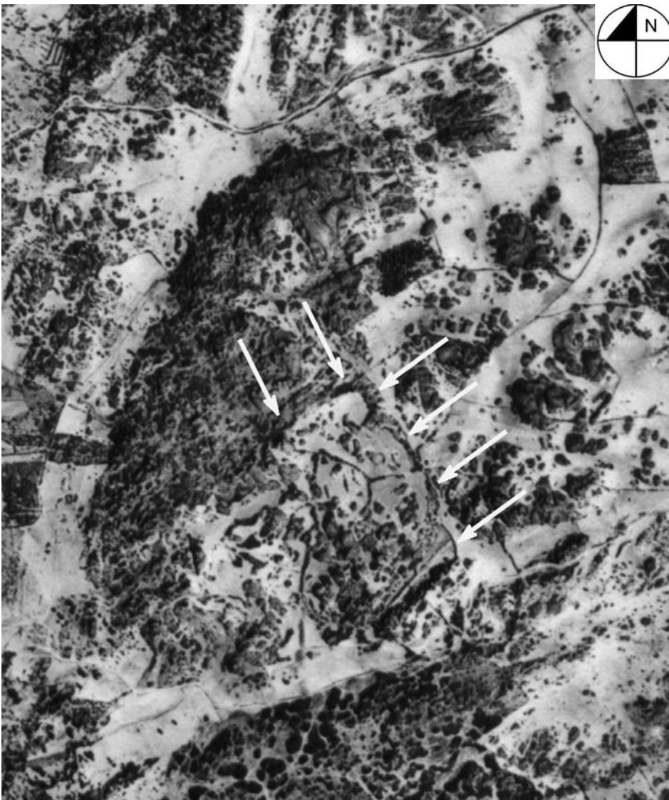
fig. 9 Fotografia aérea do Castelo dos Prados.