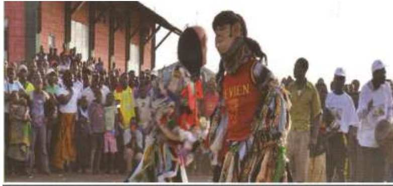
Figura 4.5: festival de Yau