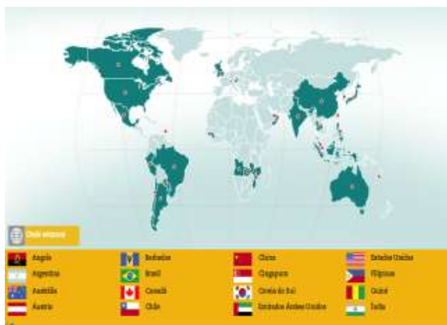
Figura 4.1:A Vale S.A. no Mundo

A VM é uma subsidiária da empresa Brasileira Vale S.A. e o primeiro projecto Greenfield da Vale S.A. fora do Brasil, e no continente africano. A Vale S.A. é a terceira maior empresa mineradora do mundo, com operações em 30 países (vide a figura 4.1 da Vale no Mundo), empregando mais de 200 mil pessoas nos 5 continentes (entre próprios e terceiros), cotadas na bolsa de valores de São Paulo (Bovespa), Nova Iorque (NYSE), Madrid (Latibel), Paris (Euronext) e Hong Kong (HKEx), nos quais desenvolve actividades de prospecção e pesquisa mineral, mineração, operações industriais e de logística (carvão, cobre, cobalto, minerais de ferro, níquel, fertilizantes e metais preciosos), com sede no Rio de Janeiro - Brasil.