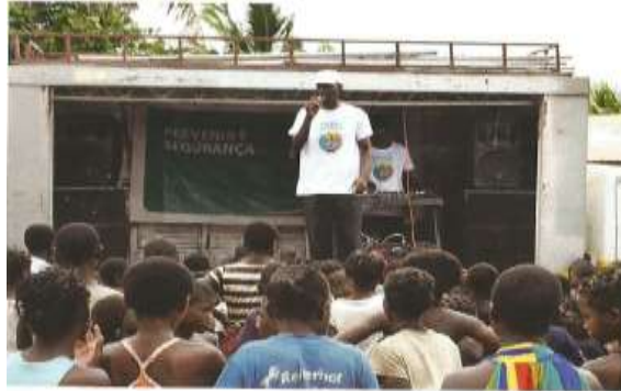
Figura 4.11: Road Show de sensibilização sobre segurança no trânsito nas comunidades em Nampula