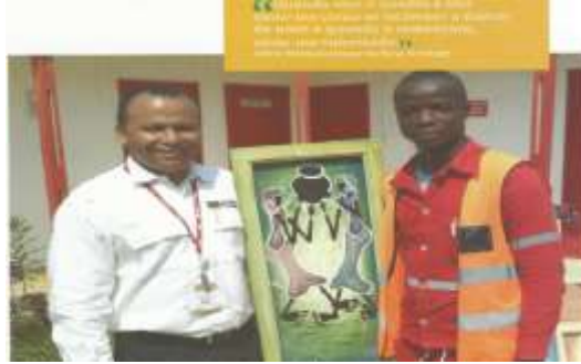
Figura 4.9:Exemplo de material reciclado que gera peça artística