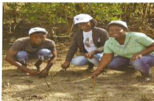
Figura 4.10:Plantio de mudas em Ndjalane

Fonte: Publicacao V+, edição 5, Dezembro de 2014.