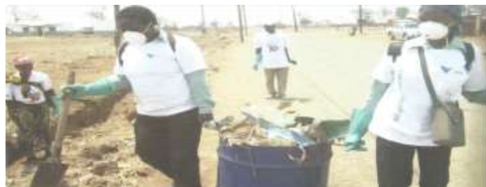
Figura 4.6: Processo de limpeza de bairros em Moatize