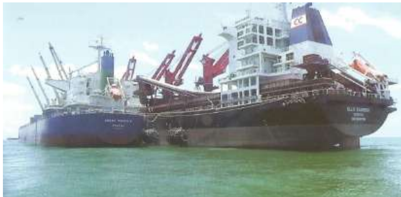
Figura 4.8: Navios Bulk Zamezi e Bulk Limpopo