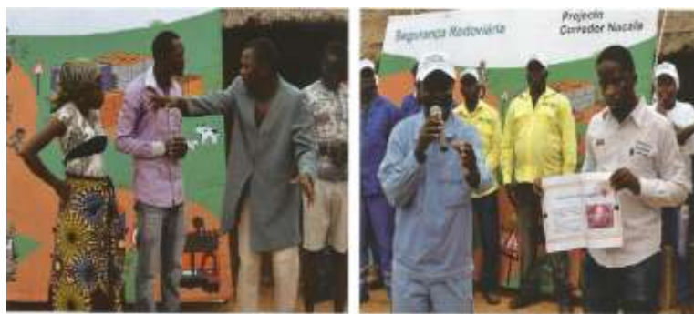
Figura 4.12: Teatro e sensibilização sobre segurança Rodoviária nas comunidades em Nacala