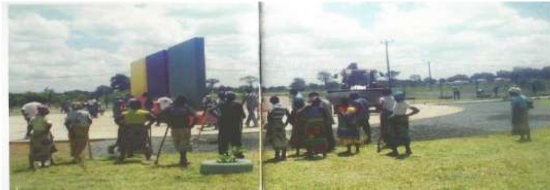
Figura 4.7: Processo de melhoria da praça da Cateme, Moatize