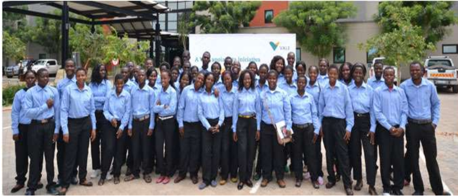
Figura 4.4: Participantes do curso de empregados domésticos e hotelaria

Cateme e 25 de Setembro que foram capacitados nas áreas de saúde, higiene, segurança, arrumação de domicílios, confecção de alimentos, jardinagem, assistência a menores e idosos, bem como ética e deontologia profissional (vide a figura abaixo).