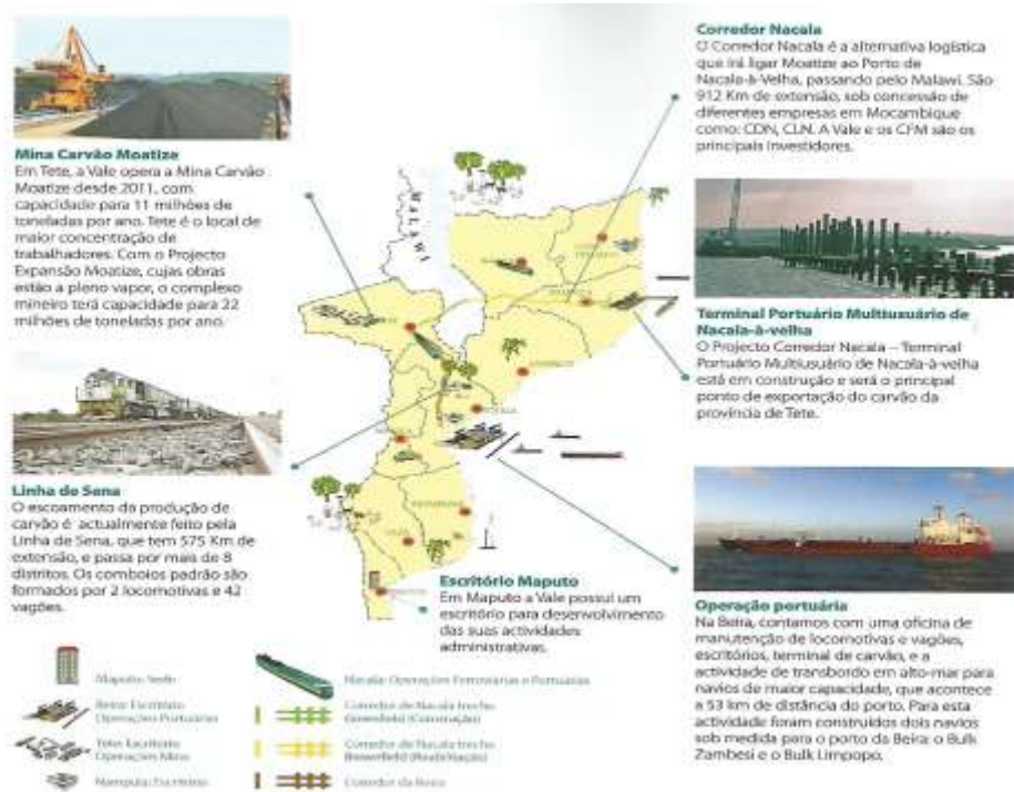
Figura 4.2:A Vale em Moçambique