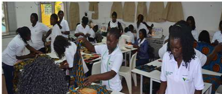
Figura 4.3: Participantes do curso de corte, costura e emponderamento feminino