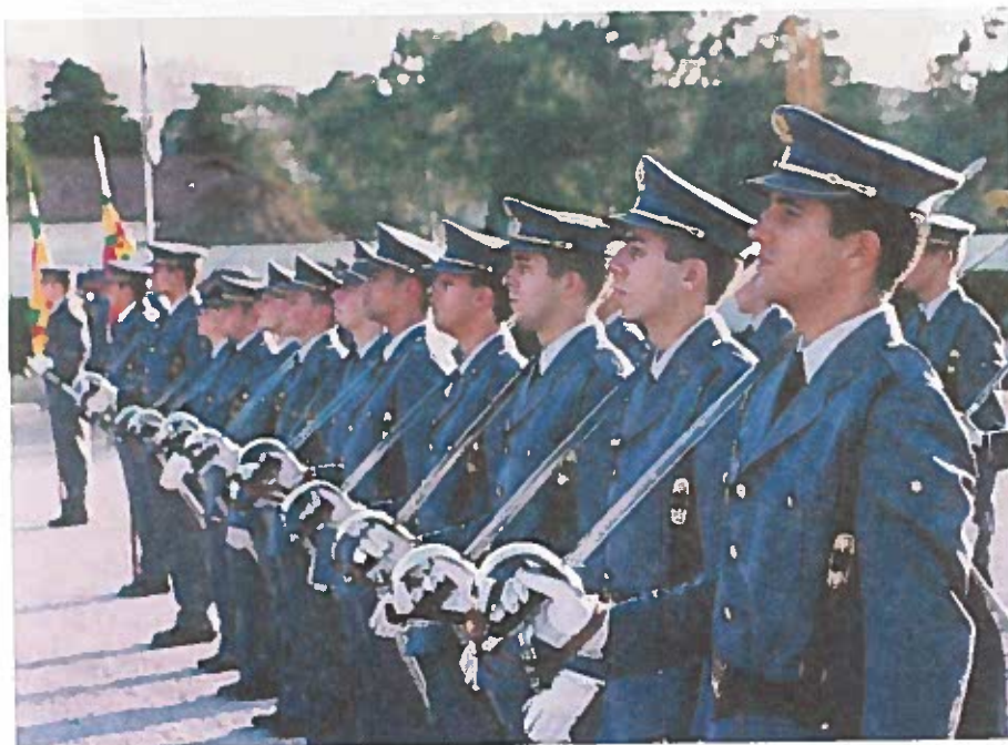
“Cerimónia conjunta de apresentação do Patrono, compromisso de Honra e de apresentação do Estandarte Nacional”, do curso “General Fortunato José Barreiros”, no Destacamento da AM na Amadora.

Paço da Rainha, em Lisboa, aos 20 dias do mês de Abril de 2004.