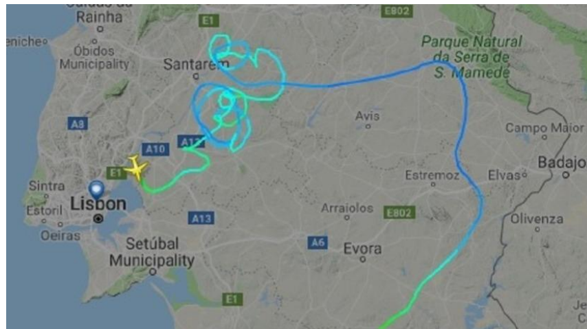
Figura 2 - Pormenor do voo