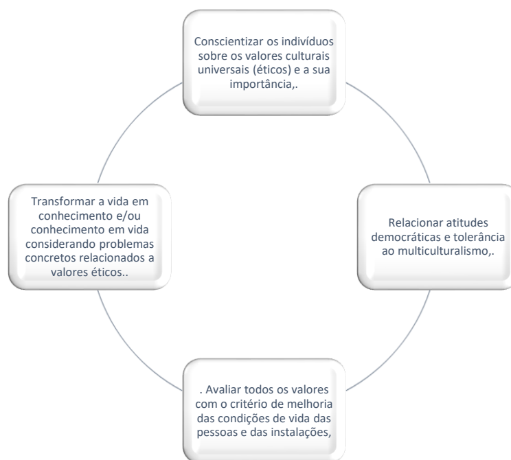
Figura 1 - Características da educação em valores

Do mesmo modo, Kale (2007) agrupou as características da educação em valores em quatro itens: