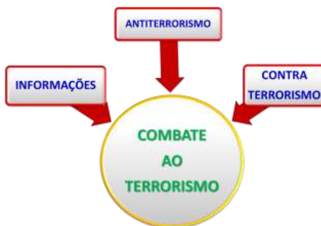
Fig. nº 7 – Modelo de combate ao terrorismo, elaborado pelo autor

Um modelo de combate ao terrorismo deve assentar em três pilares fundamentais, informações, antiterrorismo e contra terrorismo.