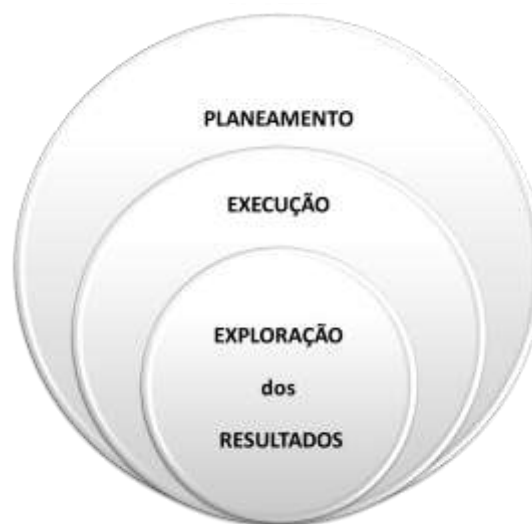
Fig. nº 3 – Ciclo genérico de planeamento e ação terrorista

De uma forma genérica o ciclo de planeamento e ação terrorista pode dividir-se em três grandes momentos: o planeamento, a execução e a exploração dos resultados.