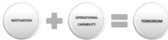
Fig. nº 1 – The terrorism equation (Ganor, 2005, p. 42)

Segundo aquele autor, podemos analisar o terrorismo em forma de equação, que apresenta como sendo o somatório da motivação e da capacidade operacional de um determinado indivíduo ou organização (Ganor, 2005, p. 42).