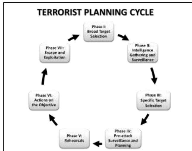
Fig. nº 4 – Ciclo de planeamento e ação terrorista, elaborado com base no USA Army (2007, pp. A1-A6)

A primeira fase, seleção de um alvo genérico, caracteriza-se pela pesquisa de informações sobre vários alvos potenciais. Os alvos potenciais são selecionados tendo por base, o objetivo pretendido, o acesso a áreas com valor simbólico, os pontos vulneráveis em infraestruturas críticas, um elevado número de vítimas e estimular a atenção dos meios de comunicação social.