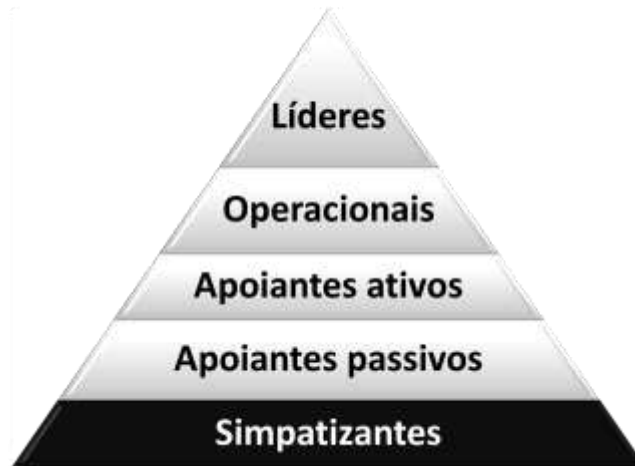
Fig. nº 2 – Estrutura das Organizações Terroristas. Elaborada pelo autor com base (USA Army, 2007, p. 3.3)

As organizações terroristas normalmente dispõem da seguinte estrutura: