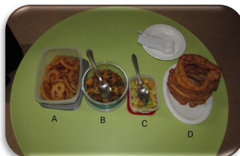
Figura 3 - Gastronomia tradicional Nepalesa

Para terminar esta intervenção, a mãe quis partilhar com o grupo quatro opções gastronómicas entre doces e salgados. Dada a proximidade da refeição as crianças puderam experimentar estas iguarias durante a hora de almoço. As especialidades que a participante levou para o grupo degustar estão apresentadas na figura 3.