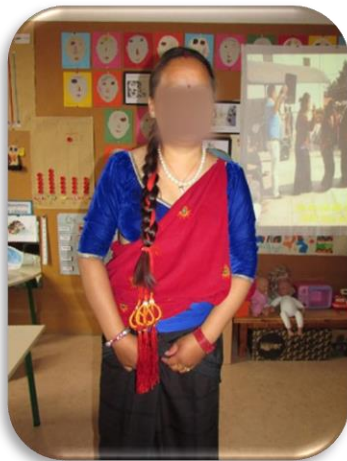
Figura 1 - Traje típico do Nepal

Em relação ao que levava vestido disse que usava um vestido de casca, com um “cholo” na parte de cima que em Portugal é uma blusa e em cima dessa blusa utilizava um lenço vermelho designado de patuka .