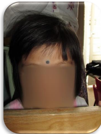
Figura 2 - Símbolo da pinta preta

Para terminar esta intervenção, a mãe quis partilhar com o grupo quatro opções gastronómicas entre doces e salgados. Dada a proximidade da refeição as crianças puderam experimentar estas iguarias durante a hora de almoço. As especialidades que a participante levou para o grupo degustar estão apresentadas na figura 3.