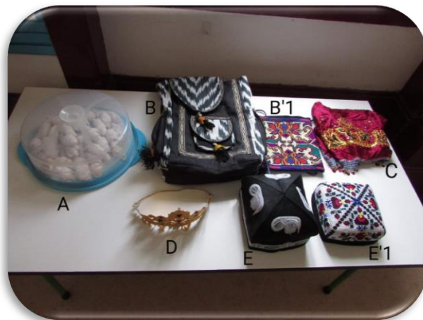
Figura 6 - Doce e acessórios tradicionais do Uzbequistão

A mãe e a irmã da D trouxeram também para mostrar às crianças as mochilas/malas tradicionais (imagens B e B'1), um lenço com cores coloridas (imagem C), mostraram também um adereço com características de comuns a uma coroa (imagem D) utilizadas como adorno principalmente nos dias de festa e os chapéus com uma forma quadrada com a particularidade de serem bordados à mão denominados por dupe (imagens E e E'1) utilizados tanto pelo homem como pela mulher.