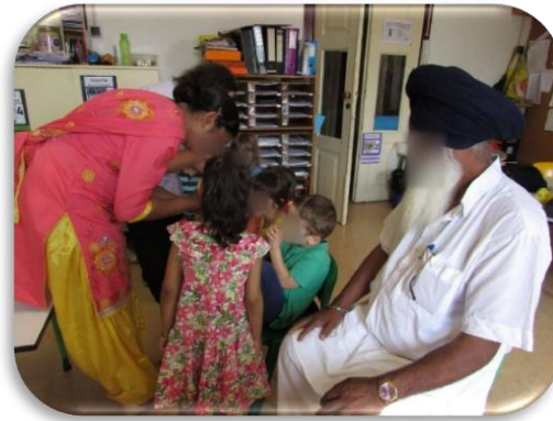
Figura 4 - Trajes típicos da Índia

A mãe usava umas calças de tecido soltas e uma túnica e um lenço compridos com tons bastante coloridos já o avô estava vestido com umas calças brancas soltas, uma túnica comprida da mesma cor e um turbante preto (figura 4).