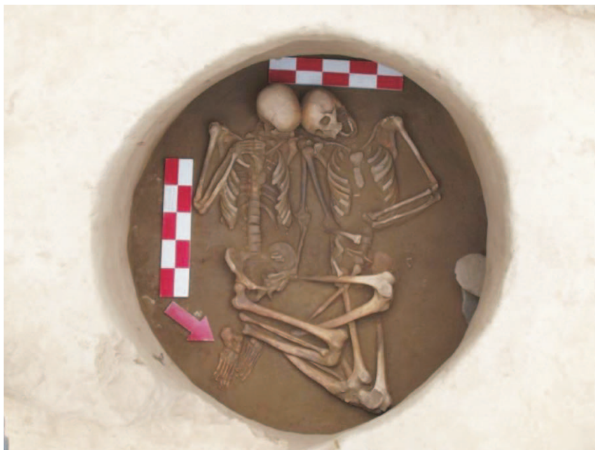
Fig.6: Enterramento duplo da Idade do Bronze médio do sítio Foz do Medal (MD).