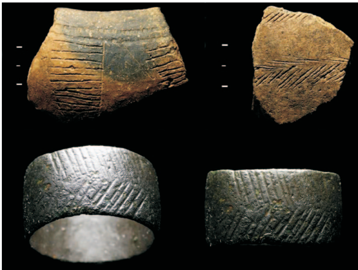
Fig.5: Componente cerâmica do período Calcolítico e Bronze inicial (em cima) e anel com decoração em espiga (em baixo) proveniente do núcleo de ocupação da Quinta do Rio.