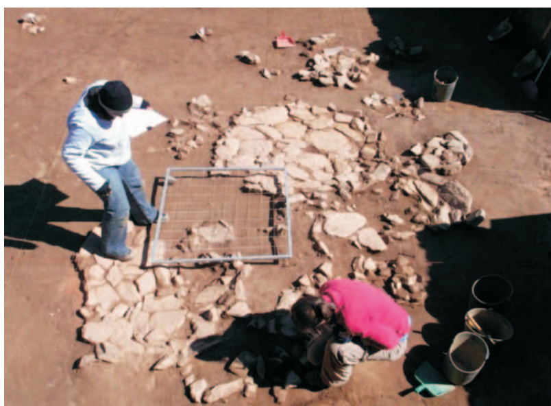
Fig.4: Pormenor de estruturas dos níveis mesolíticos do sítio Terraço do Vale da Bouça.