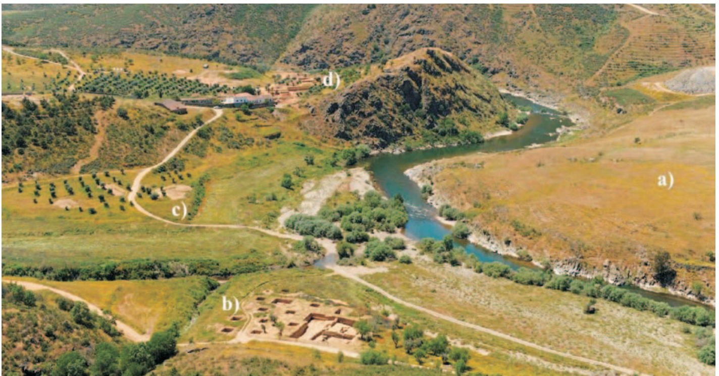
Fig.1: Área de Crestelos e Foz do Medal como exemplo da densidade e longa diacronia de ocupação humana no vale do Sabor. A ocupação deste espaço inicia-se no Paleolítico inferior (a) tendo sido identificada uma longa sequência desde o Paleolítico superior antigo ao Magdalenense em ambas as margens da foz da ribeira do Medal (b e c). Importante é também a ocupação de época Calcolítica e da Idade do Bronze do Povoado de Crestelos (d). A ocupação desta área continuou durante a Idade do ferro, período romano, Idade Média até ao século XX. É também nesta área que se localiza a Capela de Santo Antão.

Outra novidade decorrente dos trabalhos no Baixo Sabor é a presença de ocupações mesolíticas preservadas. Estas ocupações do Holoceno inicial indicam uma presença continuada na região, indicando o estudo das coleções uma proximidade com o mesolítico de entalhes e denticulados descrito por Alday (2004) para a região do Ebro. Em toda a diacronia do Paleolítico superior e Holoceno inicial existe a uma recorrente exploração de recursos locais, nomeadamente quartzo, com aplicação de técnicas específicas (Gaspar et al, submetido a). As dinâmicas destas comunidades estão ainda em estudo, pela equipa responsável. As ocupações de comunidades sedimentárias foram também identificadas ao longo do vale. Salientam-se os sítios Terraço das Laranjeiras, Núcleo da Quinta do Rio (Gaspar et al, 2014b) e Crestelos. Da Idade do Bronze não só foram identificados os sítios de povoamento como também os sítios de sepulcro (Gaspar et al, 2014a; Gaspar et al, 2014c). A caracterização das ocupações Pré-Históricas deste território de transição para o interior peninsular é fundamental, e irá continuar pela equipa responsável, sendo notórias as singularidades deste vale e a sua relação com o interior ibérico.