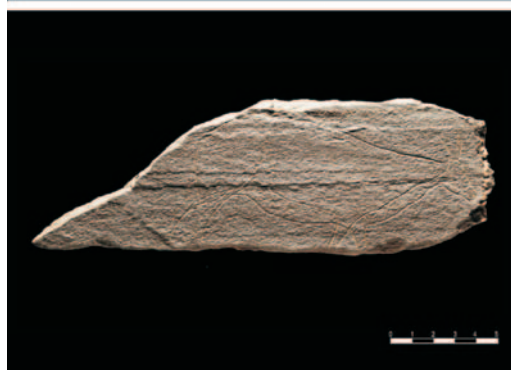
Fig. 3: Placa em grauaque com gravura incisa de um caprídeo. Exemplar de arte móvel recolhido no nível Magdalenense do sítio de ar livre Foz do Medal (MD).