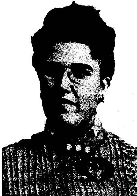
Ana de Castro Osório fundadora da Liga Republicana das Mulheres Portuguesas.

Uma mulher a pontificar no Congresso, proferindo sílaba por sílaba a palavra feminismo. Quanto mais não fosse, só por isso, o X Congresso, ficaria para a História.