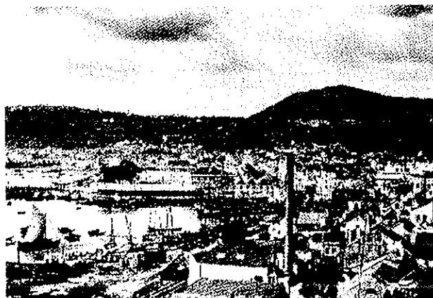
A escolha de Setúbal para a realização do Congresso

Apesar de não se terem manifestado quaisquer divergências aquando da escolha de Setúbal para a realização deste encontro partidário, verificamos que dois meses antes do Congresso esta questão vai deixar de ser consensual.