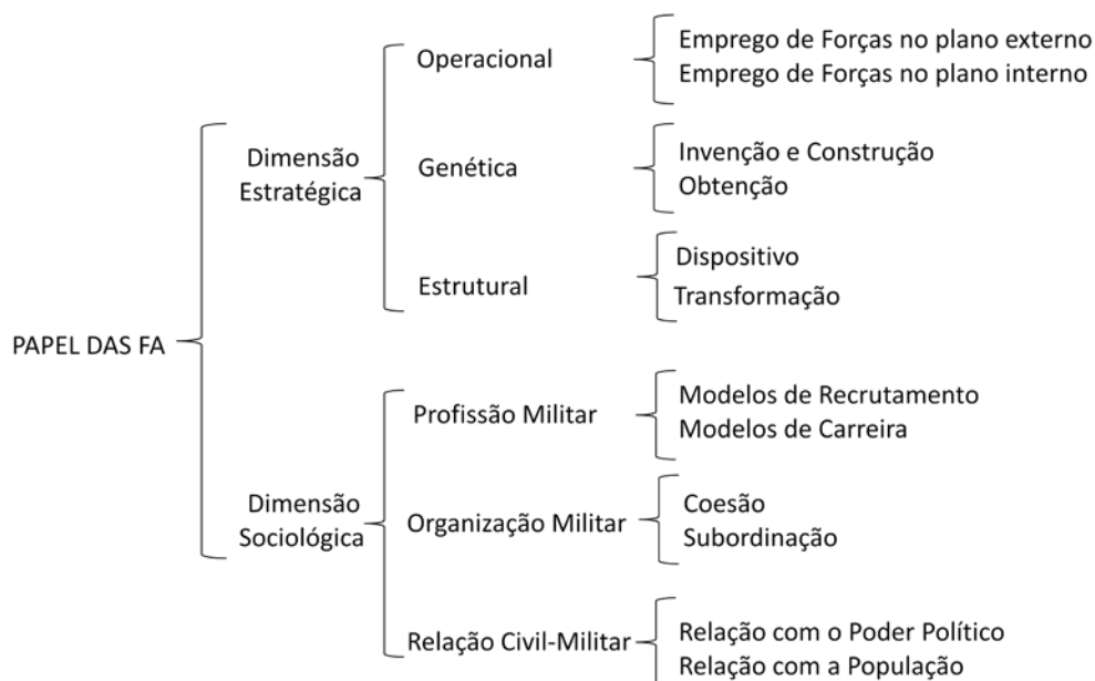
Figura 3: Conceito de Papel das FA, dimensões, subdimensões e indicadores

O papel das FA nos períodos de decadência é encarado na perspectiva da conjuntura militar, dando continuidade ao modelo de análise conjuntural utilizado no presente trabalho. Se, por um lado, interessa perceber a forma como o Estado Constitucional desenvolveu a aplicação da força, por outro lado é fundamental perceber como ocorreu, no mesmo período, a interação dos militares com os portugueses, no plano interno. Por conseguinte, o conceito de “Papel das FA” será analisado sob as duas dimensões estratégica e sociológica. Em ambas é fundamental a definição clara de indicadores, pois é a partir das semelhanças e diferenças encontradas entre estes últimos, em diferentes períodos de decadência, que se obtêm as características constantes no papel das FA.