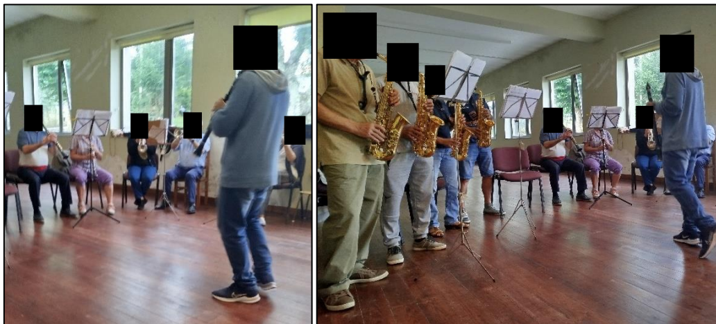
Figura 2- Dinamização do ensaio de música

tocar, como forma de guiar os mesmos. Atos que são possíveis constatar nas imagens da Figura 2.